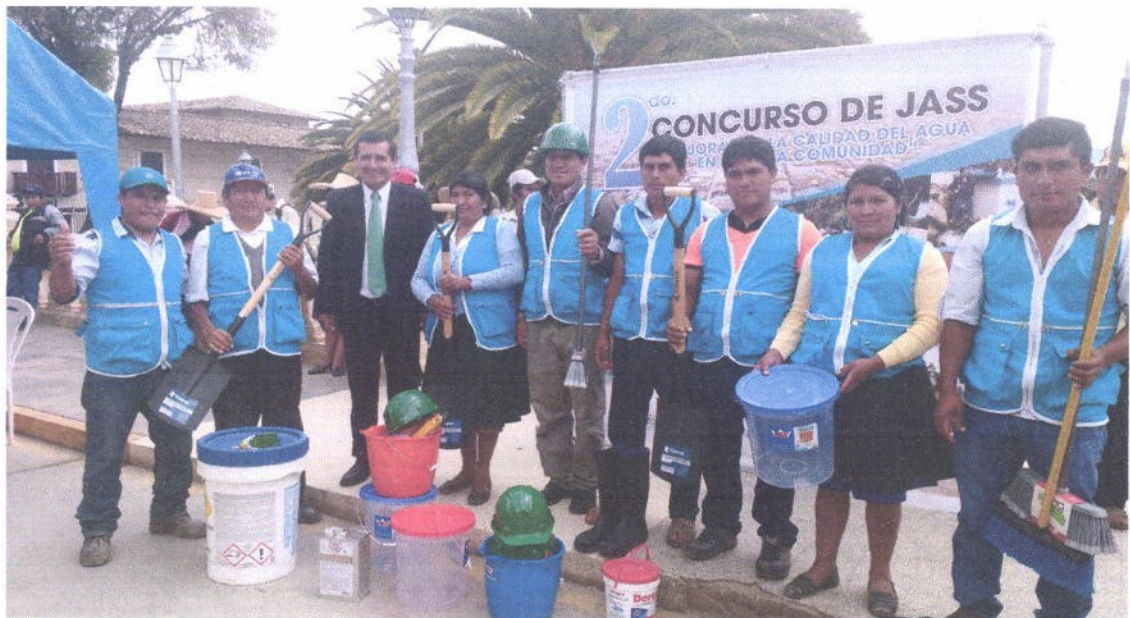
Figura 10. Desarrollo del concurso de "Buenas prácticas ambientales" con las JASS; Premiación JASS Huayllabamba