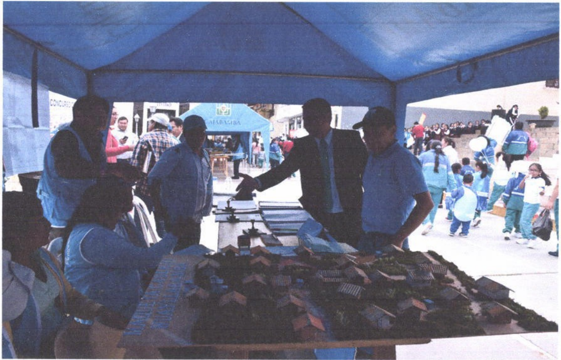
Figura 9. Desarrollo del concurso de "Buenas prácticas ambientales" con las JASS; maqueta educativa