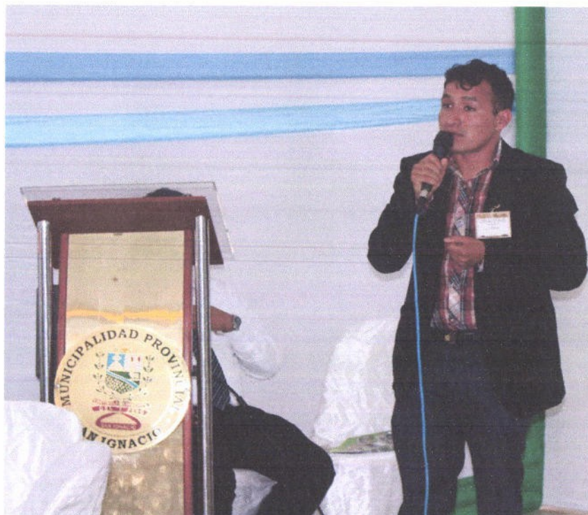
Figura 15. Participación en X Encuentro de Alcaldes integrantes de la Red de Municipios Saludables – San Ignacio – Cajamarca