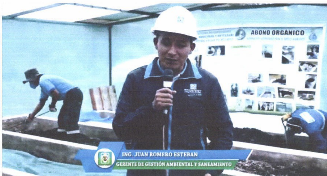
Figura 15. Entrevista al Gerente de Gestión Ambiental y Saneamiento sobre proyecto elaboración de abono orgánico