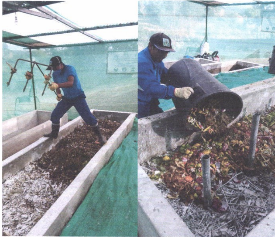
Figura 13. Elaboración del abono orgánico

“Año del Diálogo y la Reconciliación Nacional”