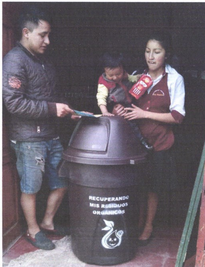
Figura 12. Entrega de contenedores para la segregación de residuos orgánicos