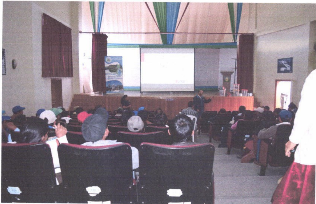
Figura 3. Capacitación a los integrantes de las juntas directivas de las JASS del distrito