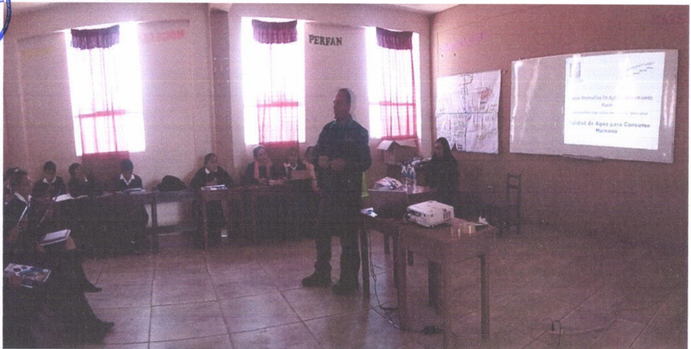
Figura 1. Capacitación a estudiantes de la I.E. Colcas