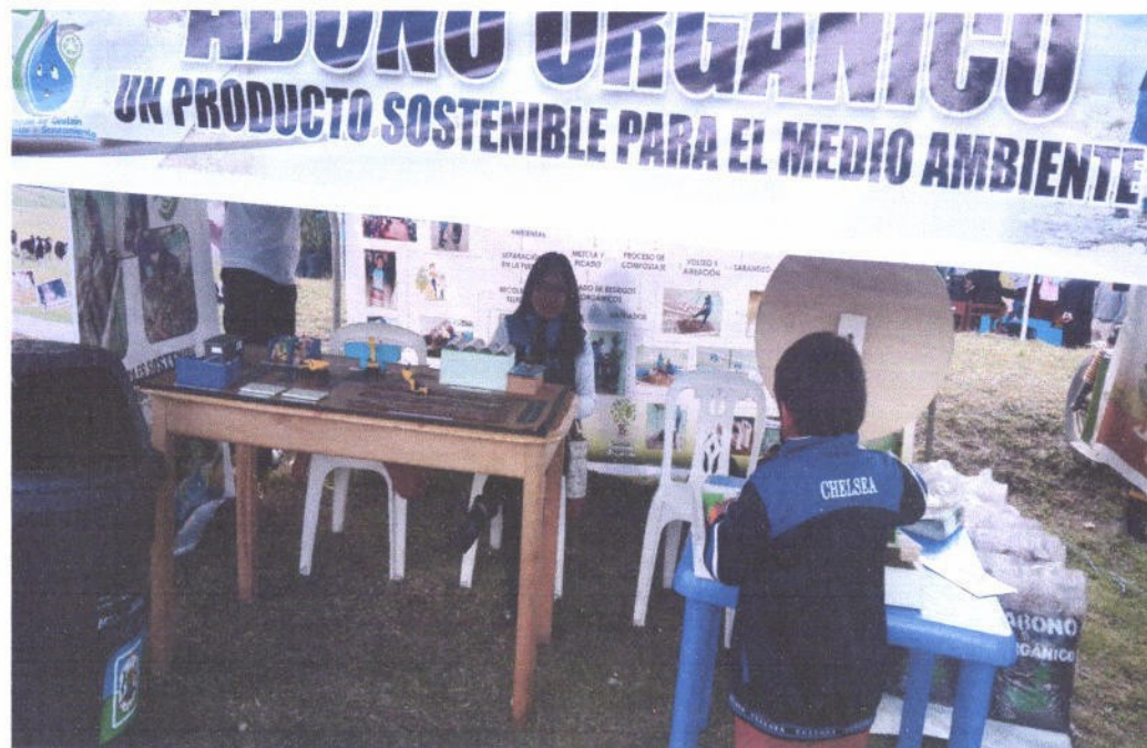
Figura 14. Participación en Ferias Agropecuarias