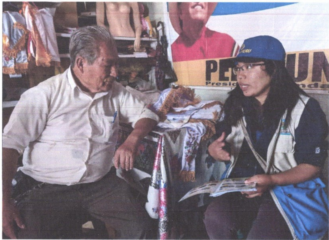
Figura 11. Capacitación a familias participantes del Proyecto

“Año del Diálogo y la Reconciliación Nacional”