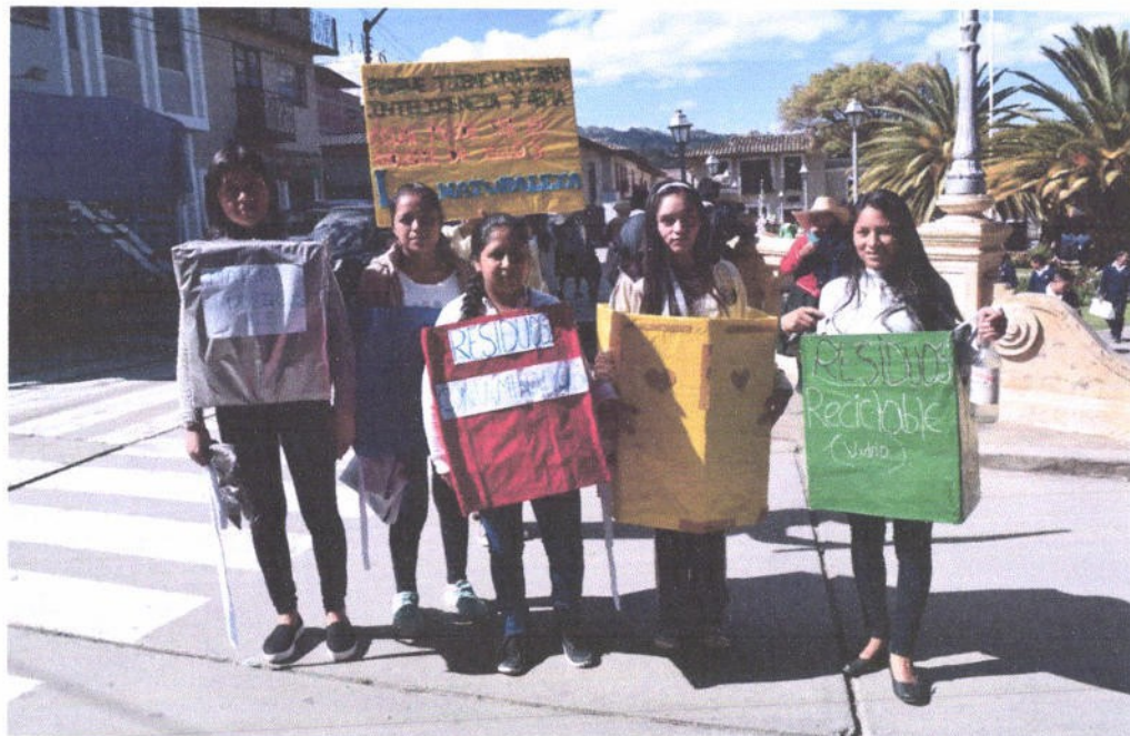
Figura 8. Concurso de pancartas por el Día Mundial del Medio Ambiente