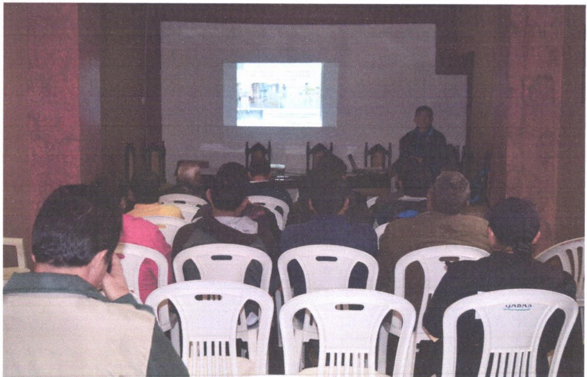
Figura 5. Taller de capacitación a las juntas vecinales sobre agua pluvial