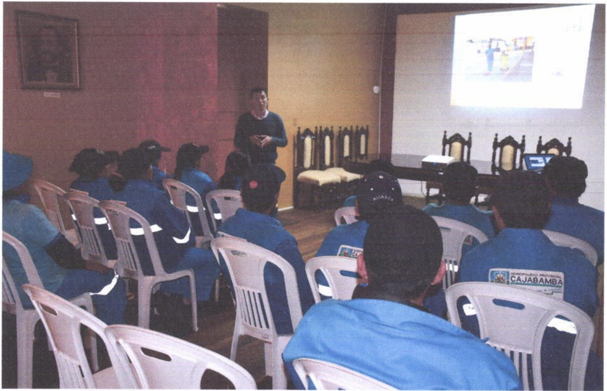
Figura 4. Taller de capacitación al personal obrero de la municipalidad