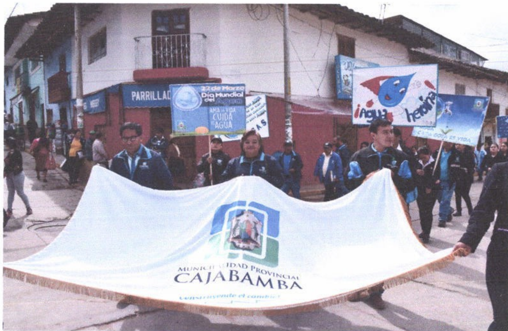
Figura 7. Pasacalle por el Día del Agua