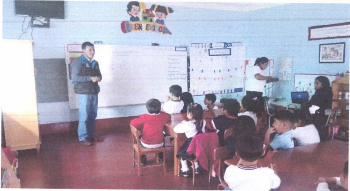
Figura 2. Capacitación a estudiantes del nivel inicial