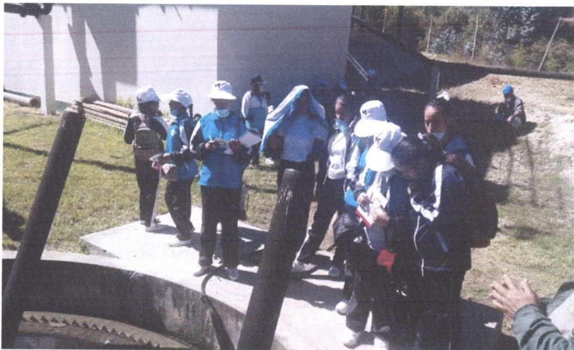
Figura 6. Visita guiada en la PTAR a estudiantes de la I.E. Micaela Bastidas – Cajabamba