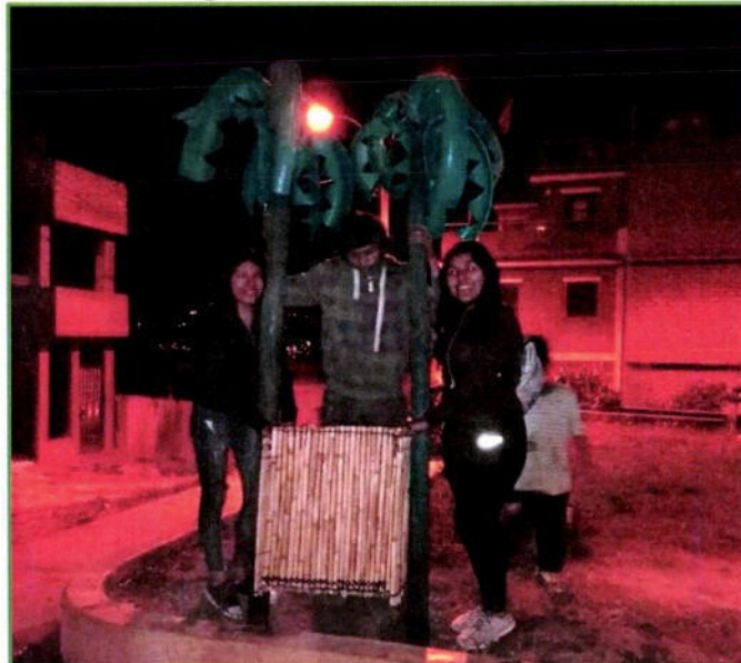
Se recuperó el Parque Infantil del Sector 3, del AA.HH. San Luis del Sector 5 del Distrito de Amarilis, en la carpeta de anexos se adjunta un video "Espacio público N° 01".