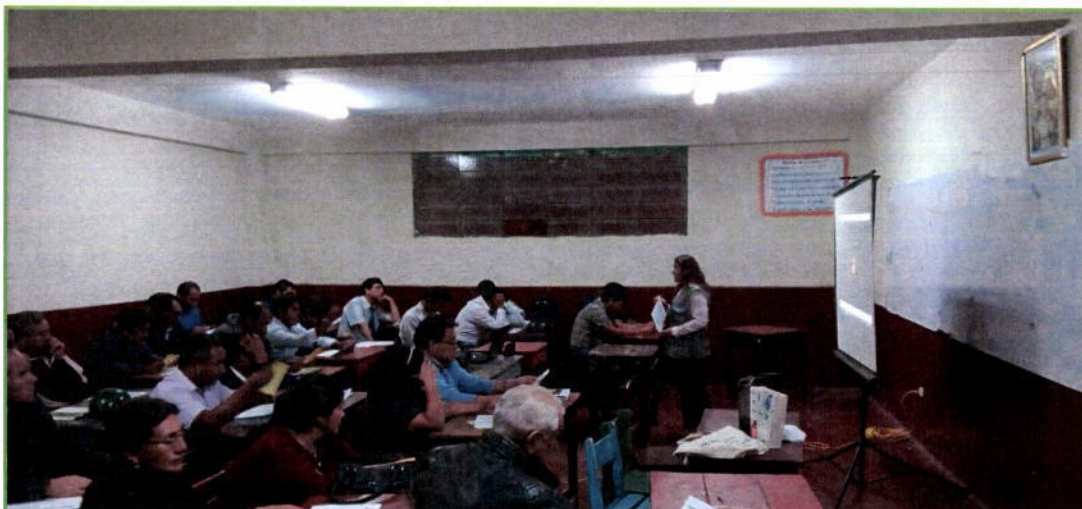
Capacitación a los Docentes de la Institución Educativa Industrial Hermilio Valdizan sobre el al Programa Municipal EDUCCA y el Programa de Segregación en la Fuente y Recolección Selectiva de Residuos Sólidos, el día 03 de abril.