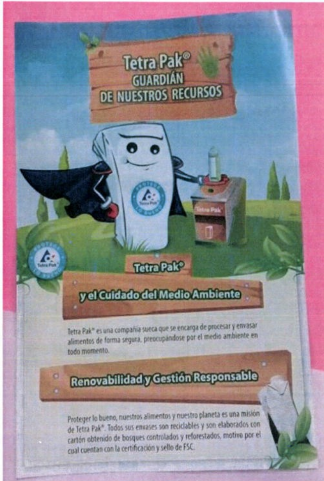
Gráfico N° 02 “Campana Tetrapack”