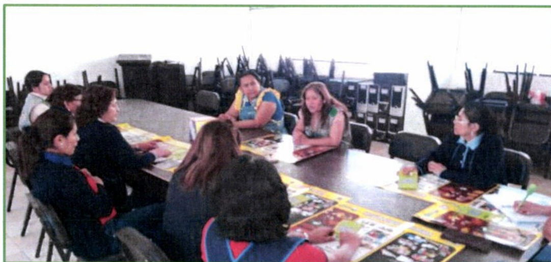
Capacitación a los Docentes de la Institución Educativa Laurita Vicuña sobre el al Programa Municipal EDUCCA y el Programa de Segregación en la Fuente y Recolección Selectiva de Residuos Sólidos, el día 31 de julio.