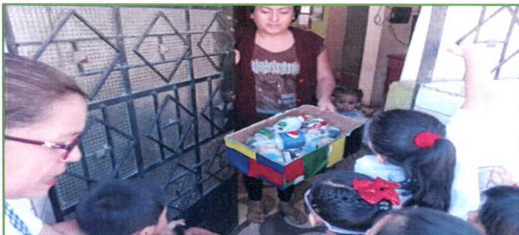
El Colegio Privado Matusita realizó el proyecto ambiental MATUGREEN que consiste en sensibilizar a los alumnos y vecinos en temas de segregación de residuos sólidos, minimización del uso de plástico, reuso de residuos, acopio de residuos aprovechables y entrega de una plantita viaiera.