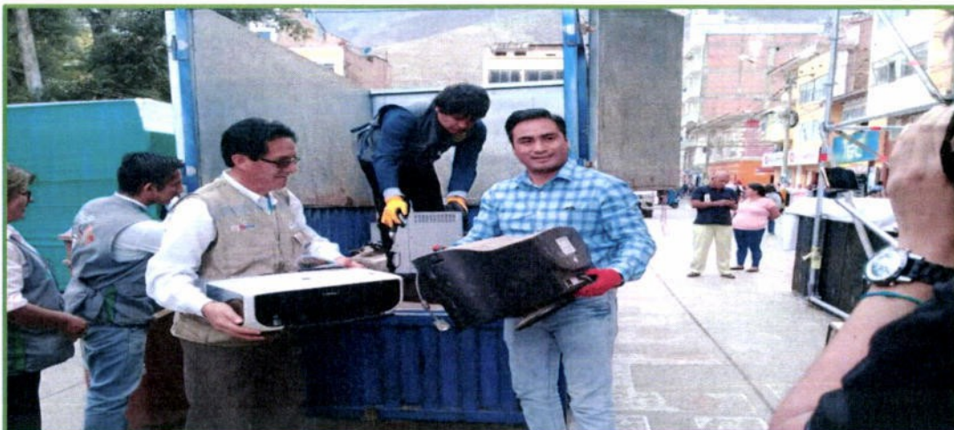
Campaña Reciclafest Huánuco 2018, el 20 de julio