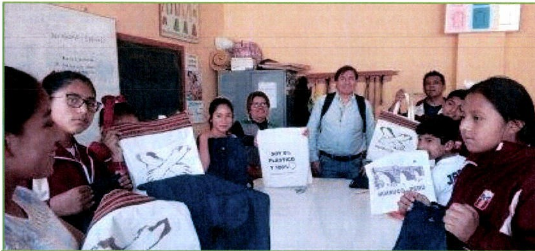
La Institución Educativa Industrial Hermilio Valdizán realiza el proyecto ambiental educativo "bolsas sanas" con diseños turísticos a nuestra ciudad, a través de los talleres de corte y confección.