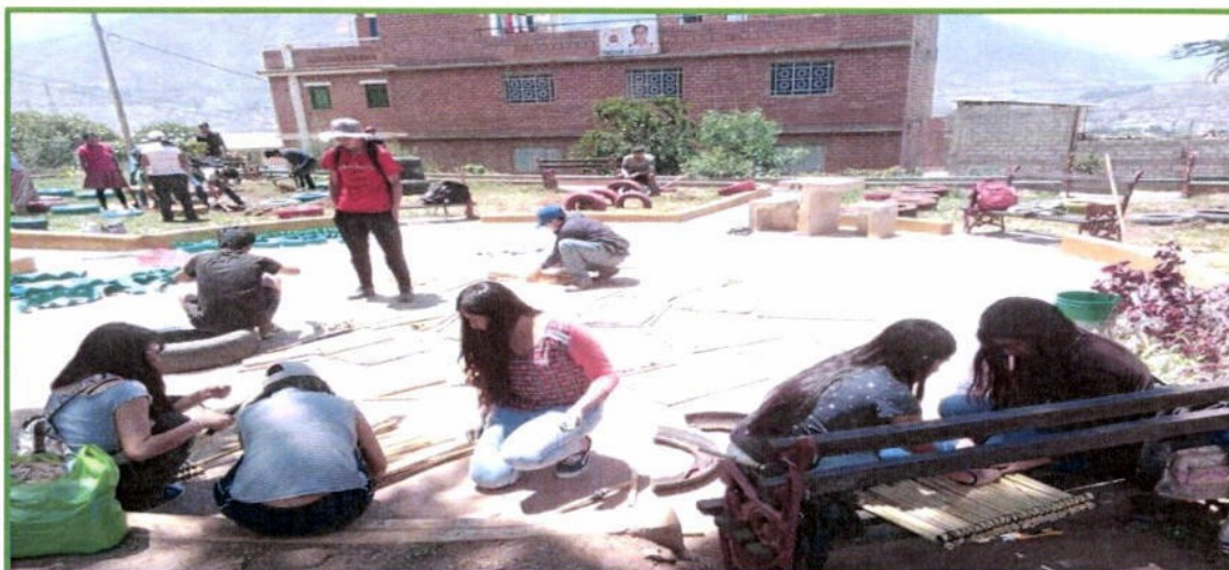
Proyecto Ambiental PAJ por la Universidad Nacional "Hermilio Valdizán", Recuperación del "Parque Infantil del Sector 3" AA. HH. San Luis - Distrito de Amarilis por