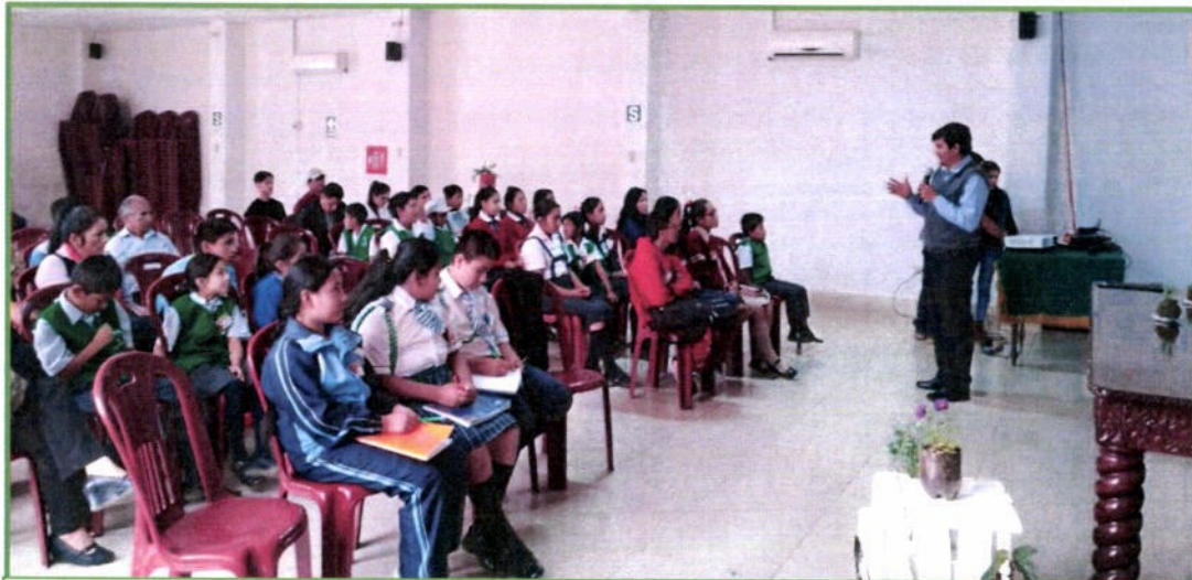
Se realizó el Primer Encuentro de Brigadas de Ambientales Escolares a las Institución Educativas del nivel primaria y secundaria integrantes al Programa Municipal EDUCCA, el día 03 de setiembre.