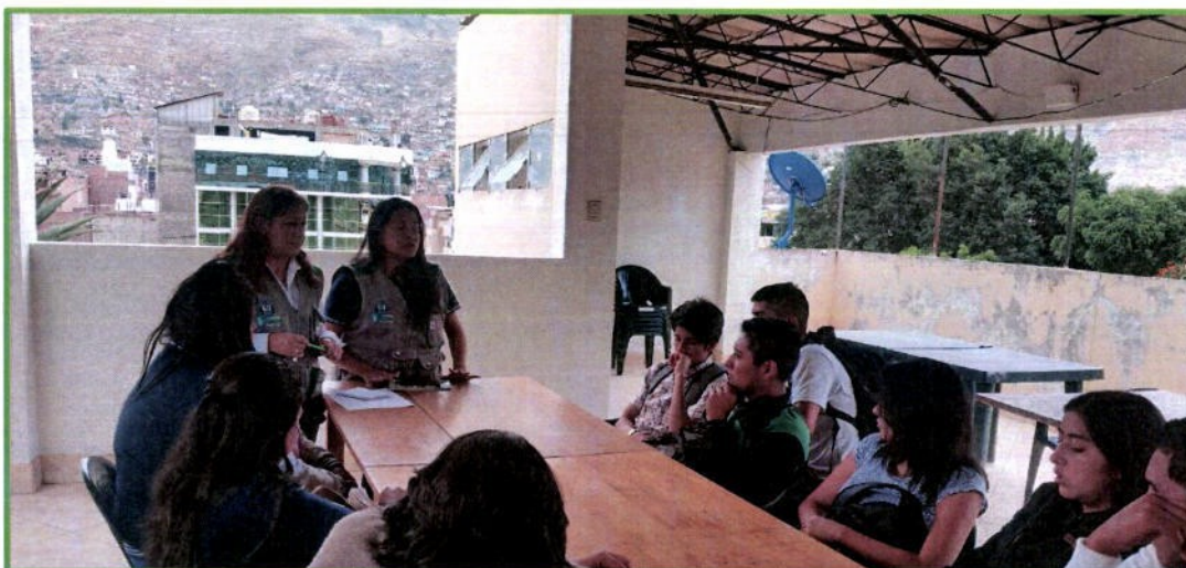
Participación de la Universidad Católica los Ángeles de Chimbote.