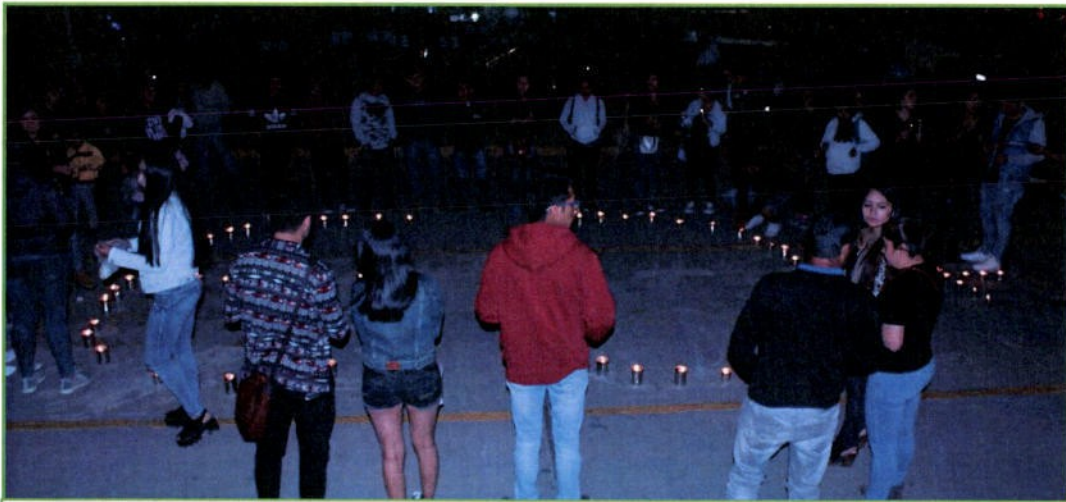
Participación de los PAJ de la Universidad de Huánuco, Universidad en la Actividad "La Hora del Planeta", 28 de marzo