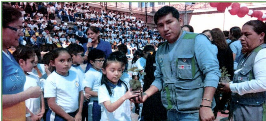
Campaña Adopta una Planta, 23 de julio