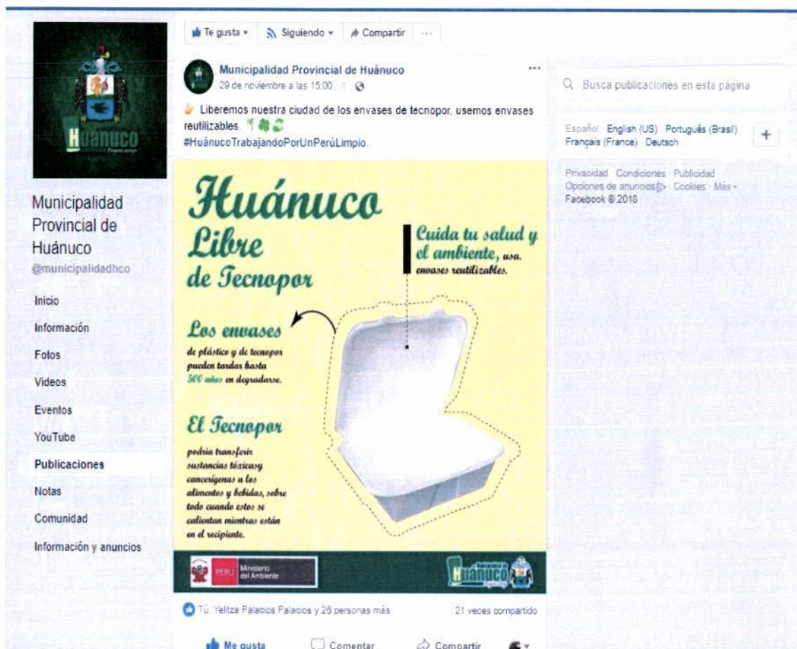
IMAGEN N° 01

La publicación de las actividades está en el Facebook: Municipalidad Provincial de Huánuco