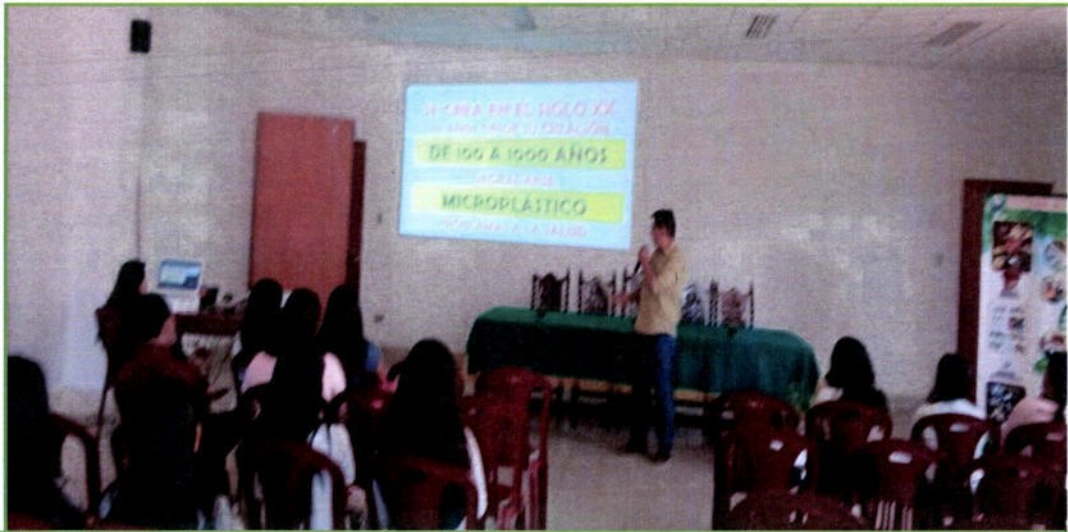
Primer Encuentro de Redes Juveniles, 04 de setiembre