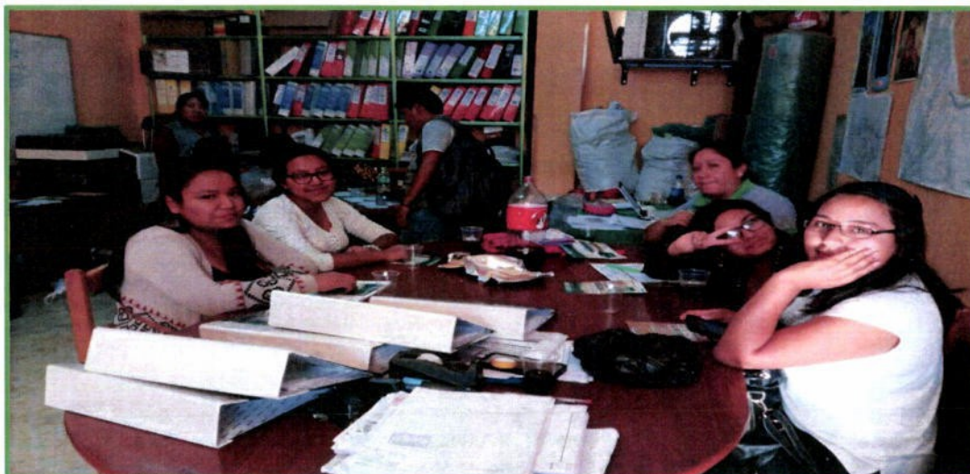
Participación de la Universidad de Huánuco