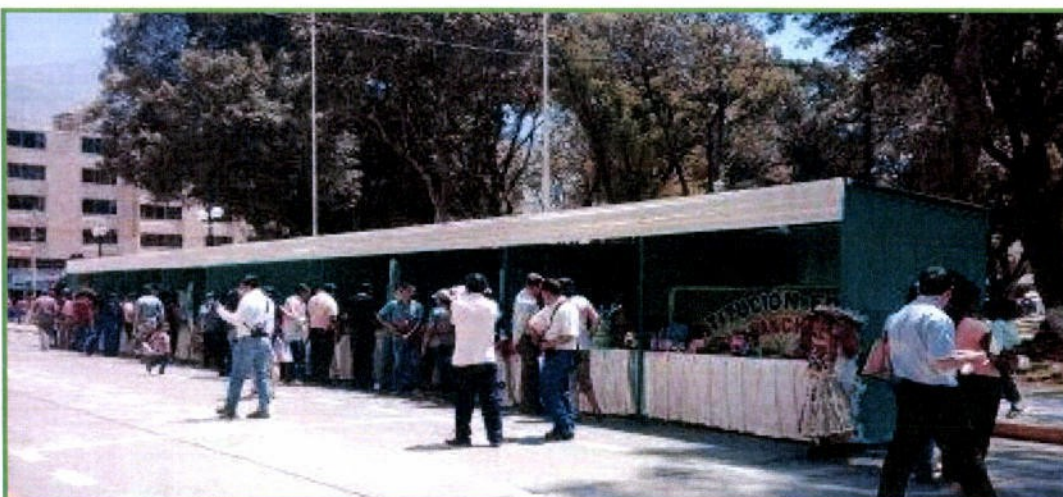
Feria para la Gestión Adecuada de Residuos Sólidos, el 07 de setiembre