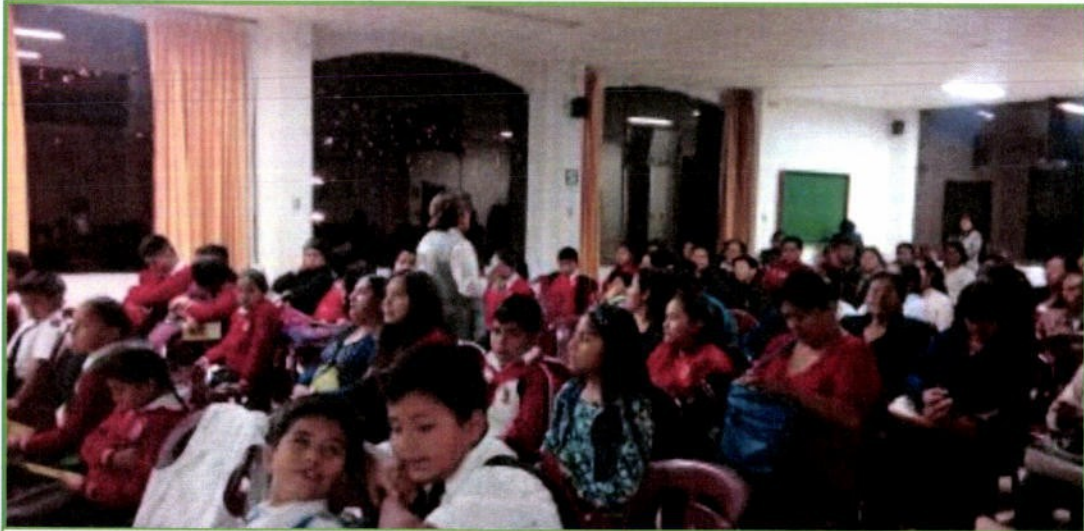
Se realizó la capacitación a los Promotores Ambientales Escolares de la Institución Educativa "Juana Moreno" del nivel primaria y secundaria, el día 29 de mayo.