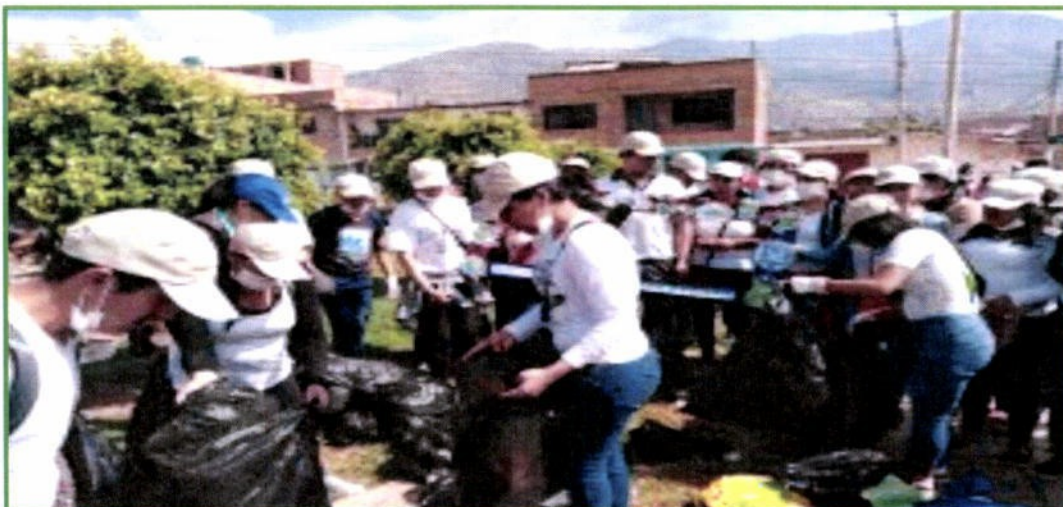
Campana de limpieza del mercado del Distrito de Amarilis, el 25 de agosto.