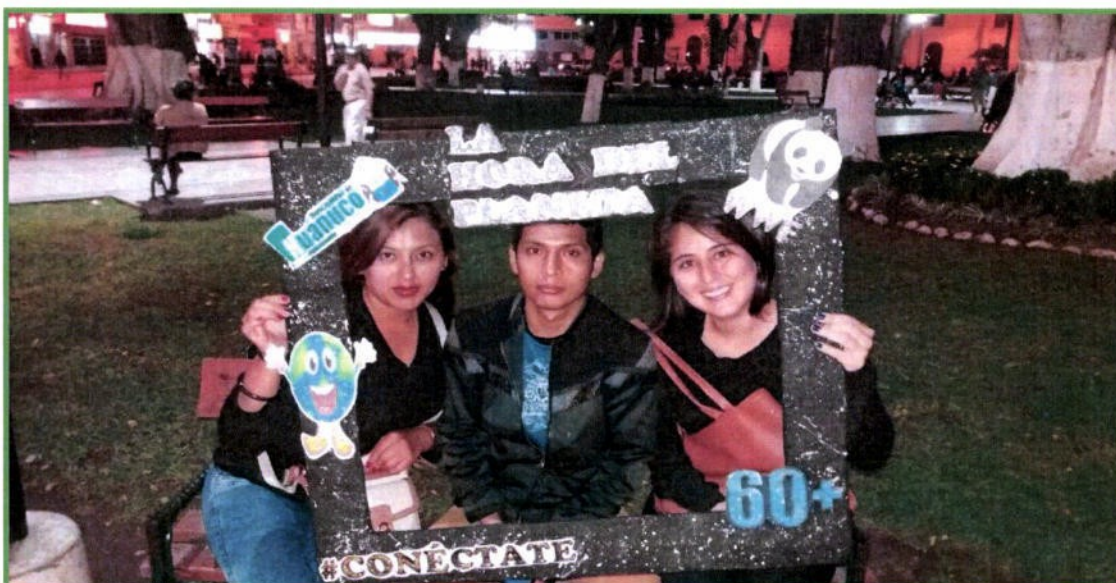
Proyecto Ambiental PAJ por la Universidad de Huánuco, por el Día del Ahorro y Eficiencia Energética.