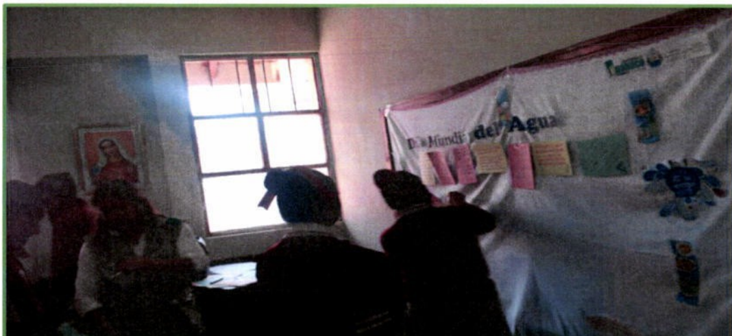
Evento "Día Mundial del Agua" con la I. E. I. Hermilio Valdizán, 22 de marzo