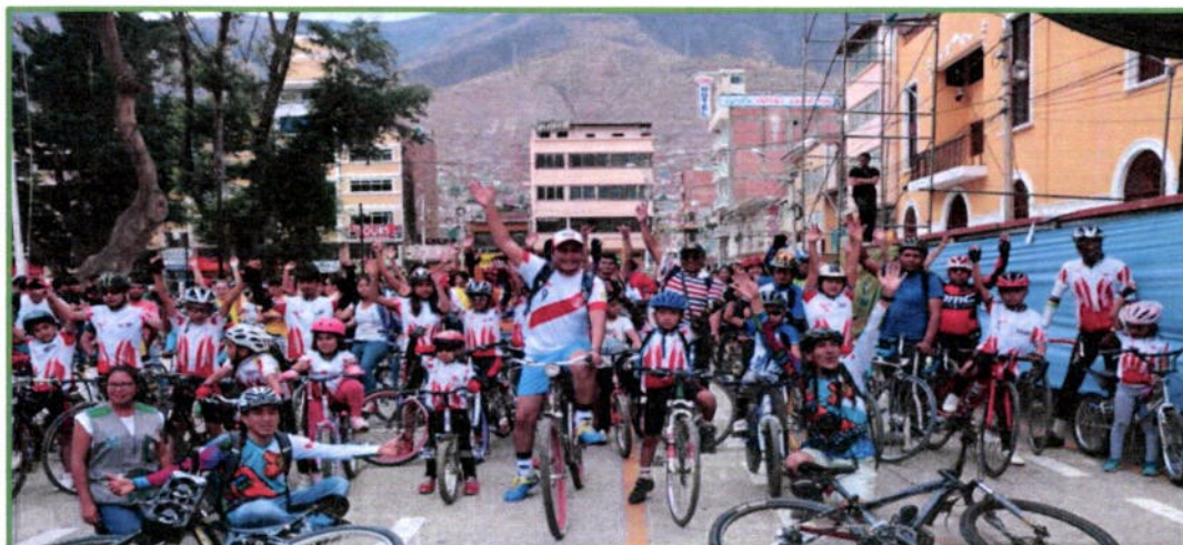
Huánuco Maneja Limpio y Saludable, Gran Eco bici Caravana – Día Mundial sin Autos, 23 de setiembre