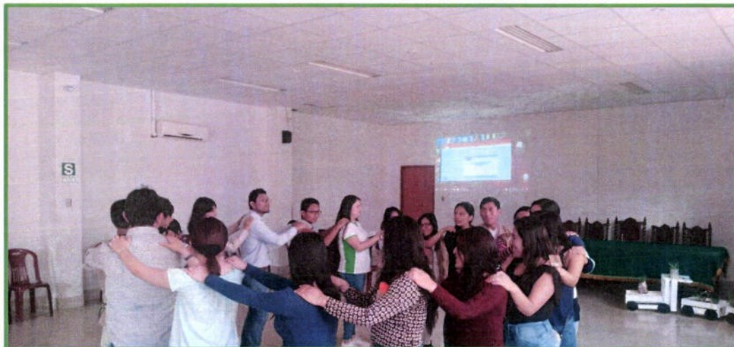
Taller de Capacitación de Redes Juveniles, 20 de setiembre