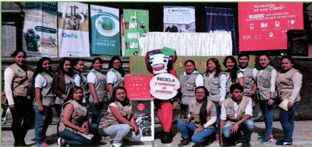
Participación de los PAJ de la Universidad Nacional Hermilio Valdizán de Huánuco y Universidad de Huánuco el RECICLAFEST Huánuco 2018