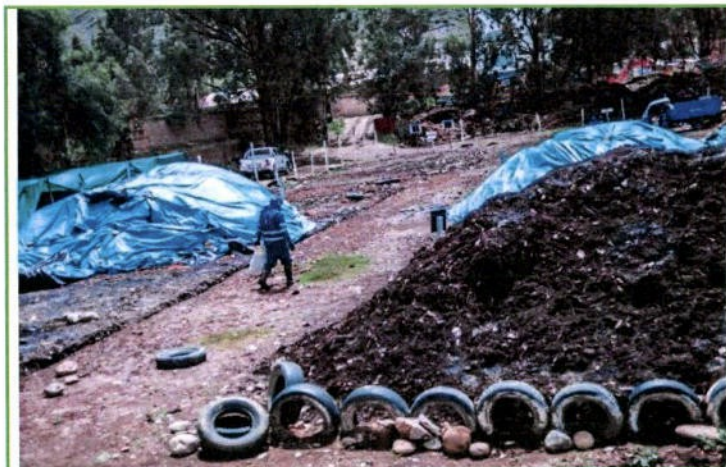
Se adecuo la Planta de Valorización de Residuos Orgánicos e Inorgánicos de la Municipalidad provincial de Huánuco.