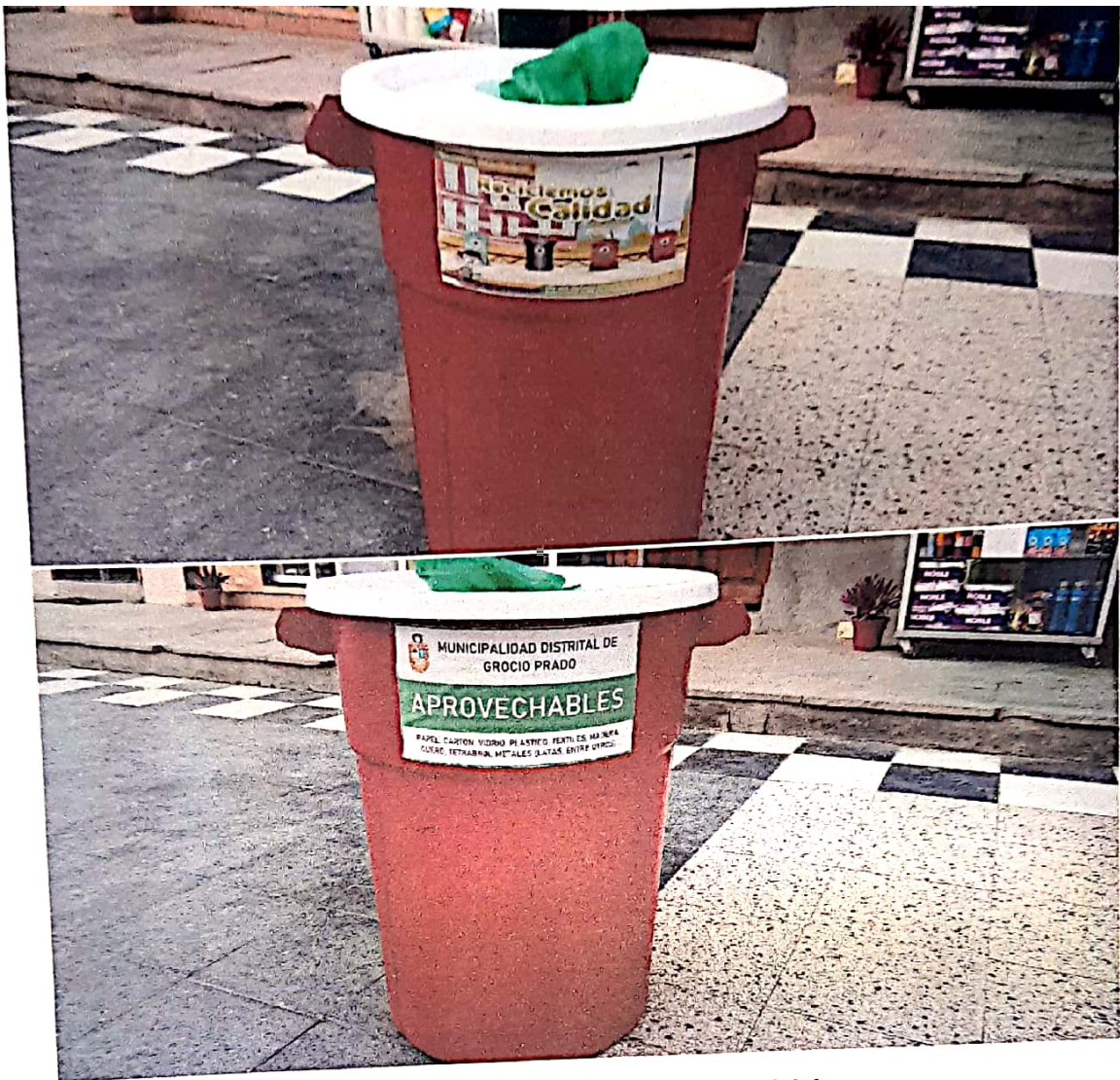
Instalación de contenedores para reciclaje