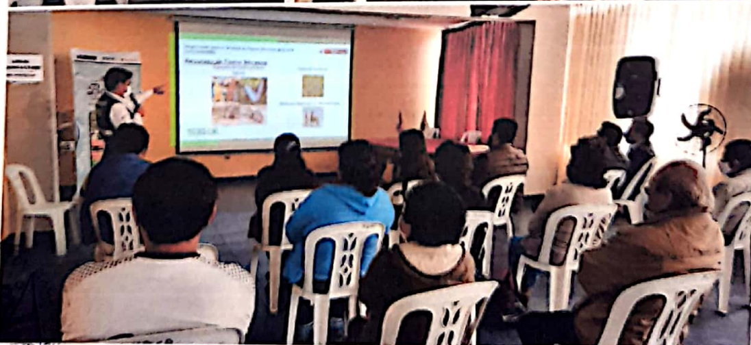
Taller de capacitación a los artesanos del distrito en coordinación con SERFOR.