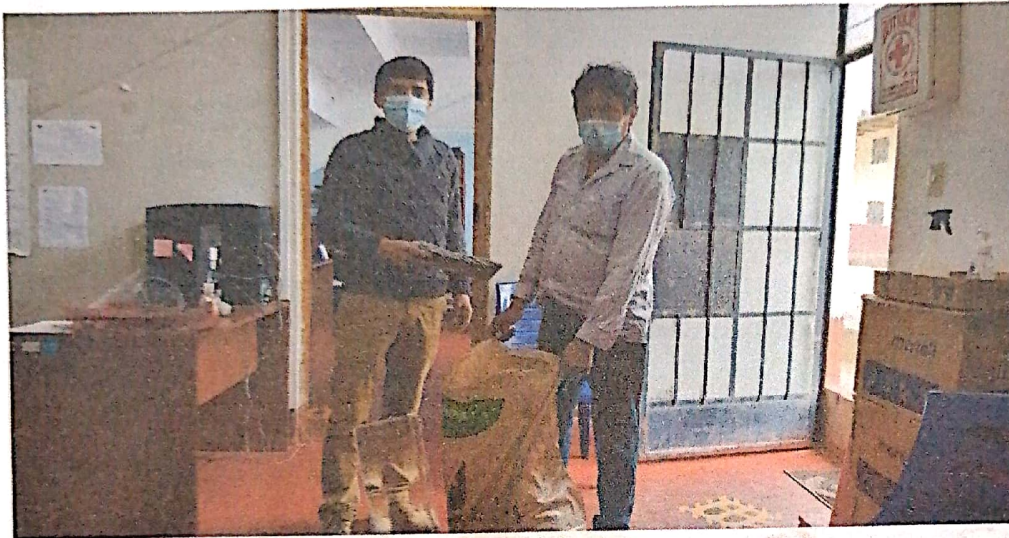
2.1. Entrega de bolsas e insumos para la campaña 2021-2022