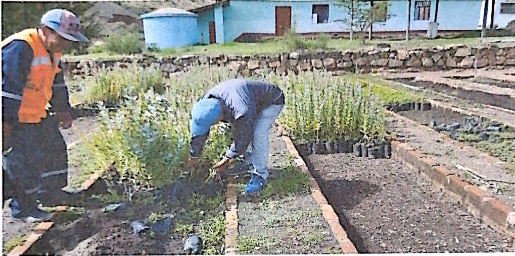
5. Entrega de plántones forestales Vivero Mogol

GERENCIA DE DESARROLLO ECONÓMICO Y MEDIO AMBIENTE