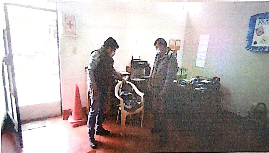
2. Entrega de EPP del carro recolector - MDJ