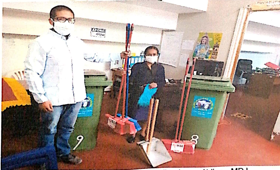
4. Entrega de insumos y equipos para la limpieza pública - MDJ