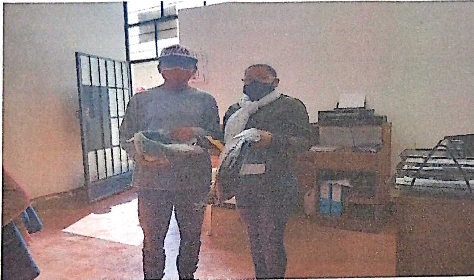
3. Entrega de EPP al personal de limpieza de barrido de calles.

GERENCIA DE DESARROLLO ECONÓMICO Y MEDIO AMBIENTE