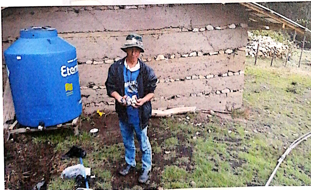
2.2 Entrega de materiales para la instalación del tanque de agua