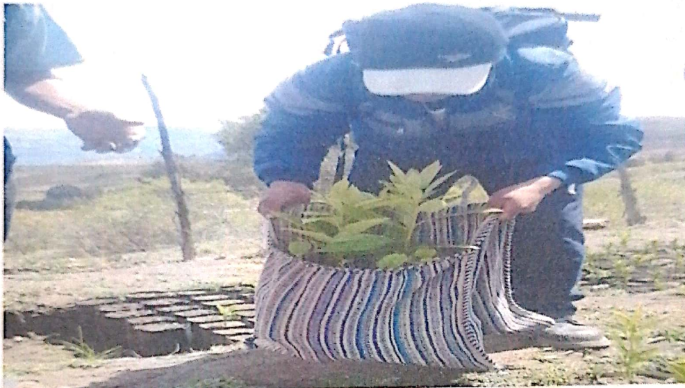
2.3. Entrega de plántones de frutales

GERENCIA DE DESARROLLO ECONÓMICO Y MEDIO AMBIENTE