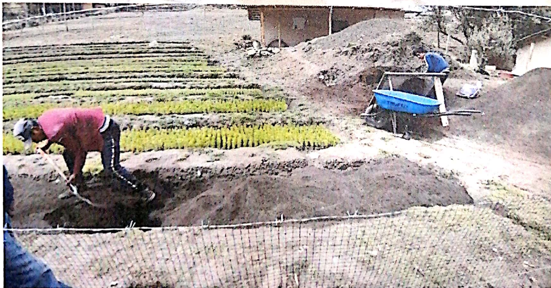
8. Instalación de almácigos – Vivero Huayanamarca