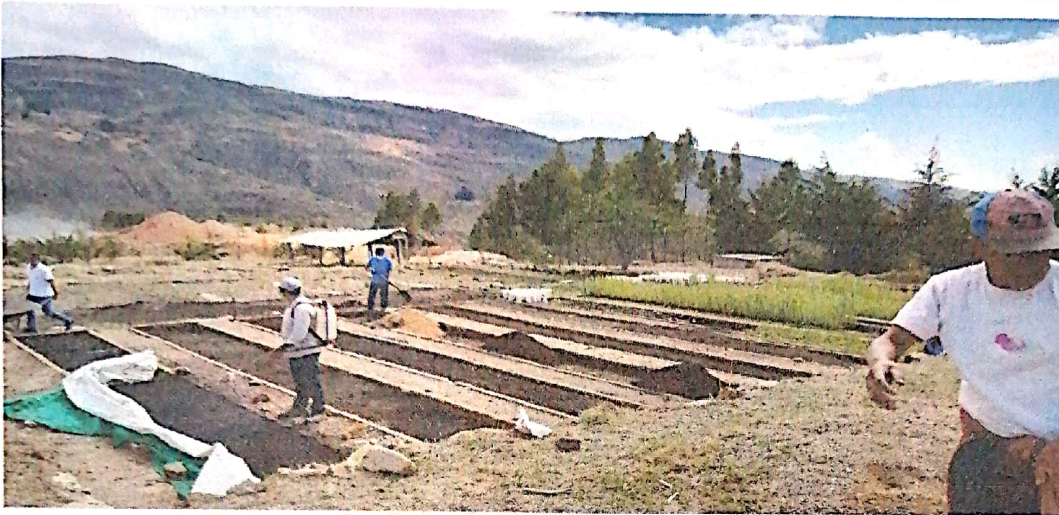
7. Instalación de los almácigos – Vivero La Shita

GERENCIA DE DESARROLLO ECONÓMICO Y MEDIO AMBIENTE