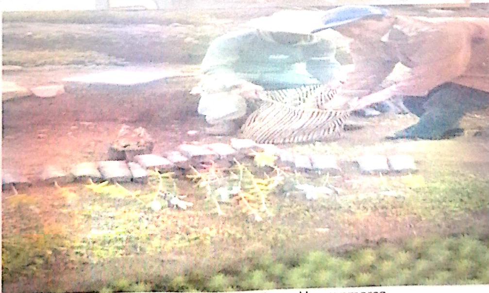
4. Entrega de plántones de forestales – Vivero Huayanmarca