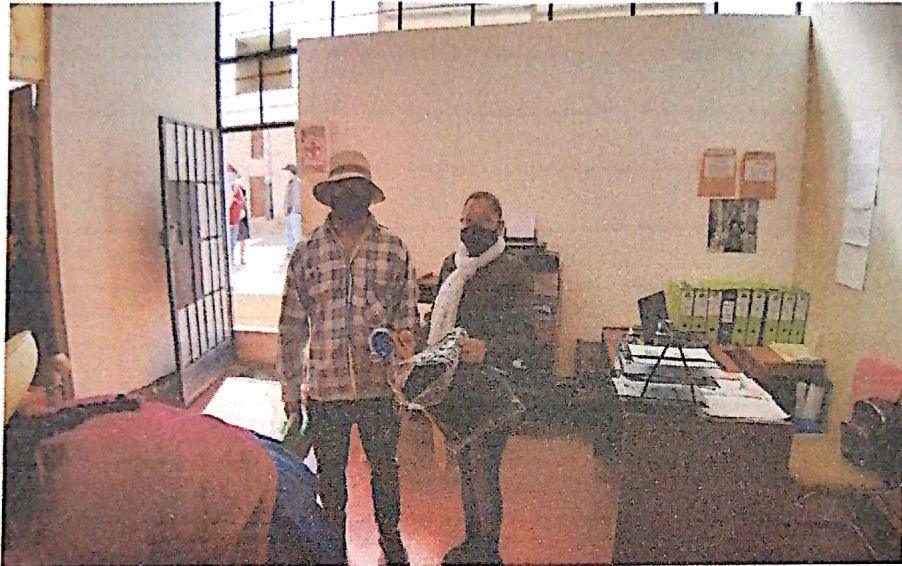
1. Entrega de EPP a obreros del botadero Tabada - Disposición final.