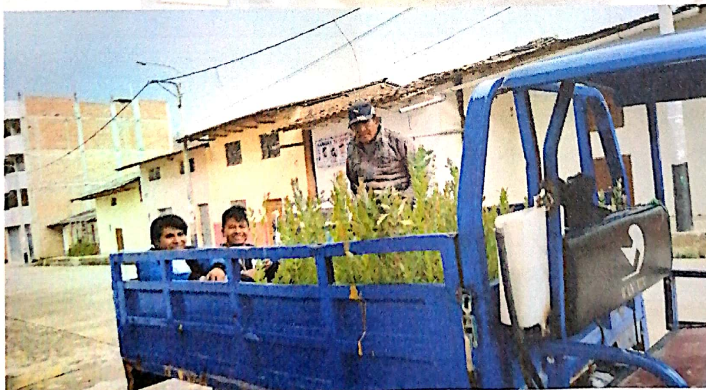
6. Traslado de plántones a los caseríos