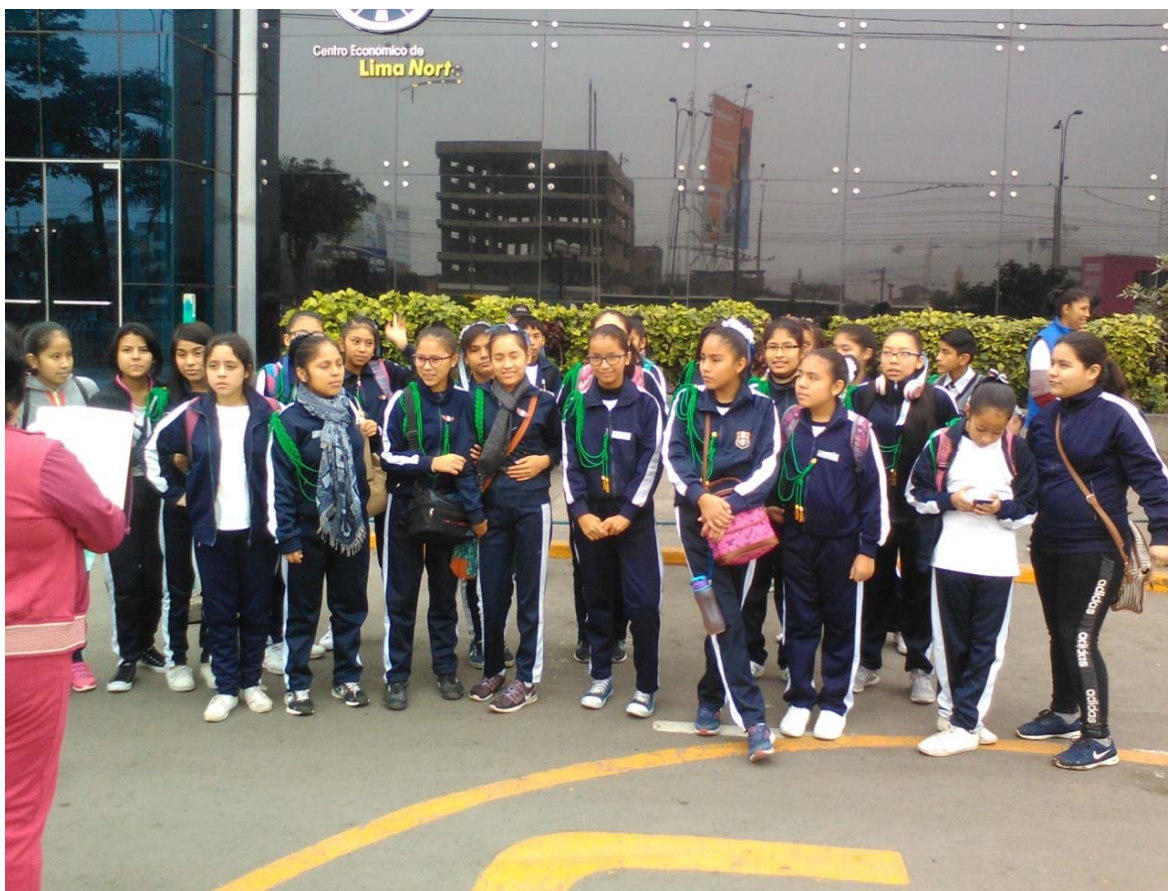
EN EL FRONTIS DE LA MUNICIPALIDAD DE INDEPENDENCIA ANTES DE SALIR AL PARQUE DE LAS LEYENDAS

VISITA DE ESTUDIOS AL PARQUE DE LAS LEYENDAS DIA 30 DE JUNIO DEL 2018 INSTITUCIONES EDUCATIVAS GRAN BRETAÑA Y II. EE. SANTIAGO ANTUNEZ DE MAYOLO