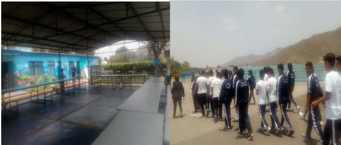
PROMOTORES AMBIENTALES ESCOLARES DE LA II. EE. EL MILAGRO VISITANDO LAS INSTALACIONES DE LA ATARJEA – RAMIRO PRIALE.