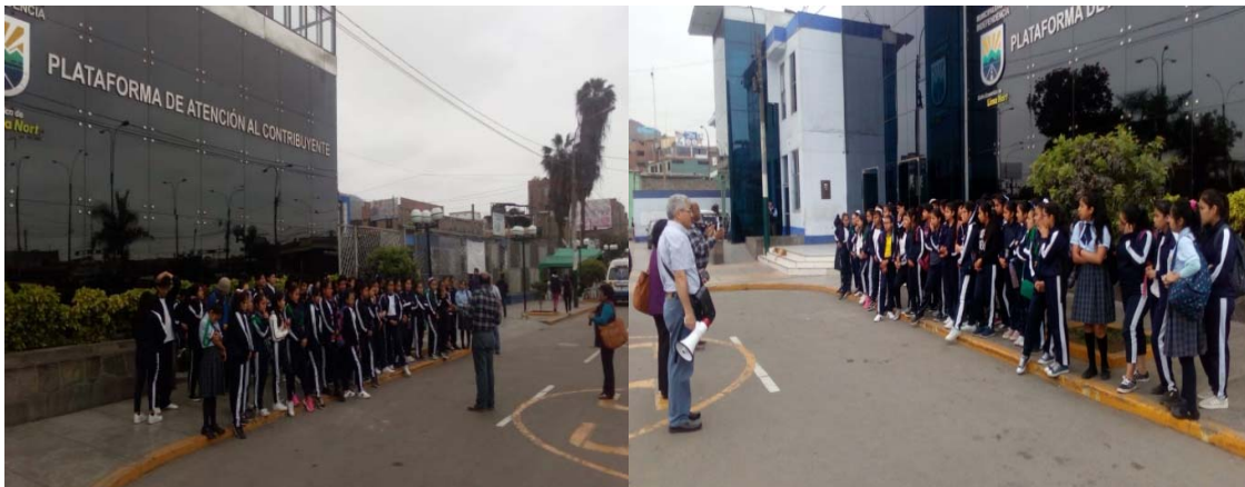
- PROMOTORES AMBIENTALES ESCOLARES DE LA II. EE. SANTIAGO ANTÚNEZ DE MAYOLO Y LA II. EE. "SAN MARTIN DE PORRES