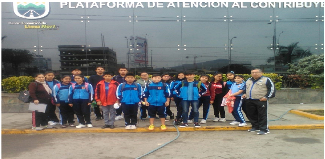
Promotores Ambientales Escolares de la II.EE. María Auxiliadora de Túpac Amaru en el Frontis de la Municipalidad de Independencia antes de visitar el Parque "Las Voces por el Clima"