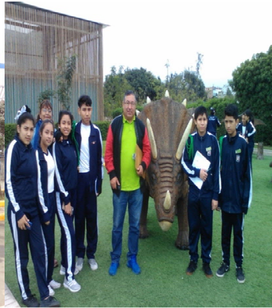
VISITA DE ESTUDIOS AL PARQUE "LAS VOCES POR EL CLIMA" SURCO. 25-08-2018