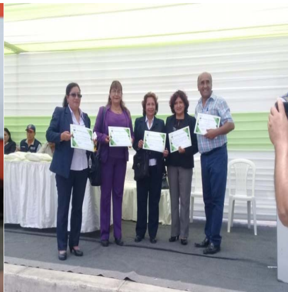
Independencia, noviembre 2018. J.A.S.G /GGA/ MDI.