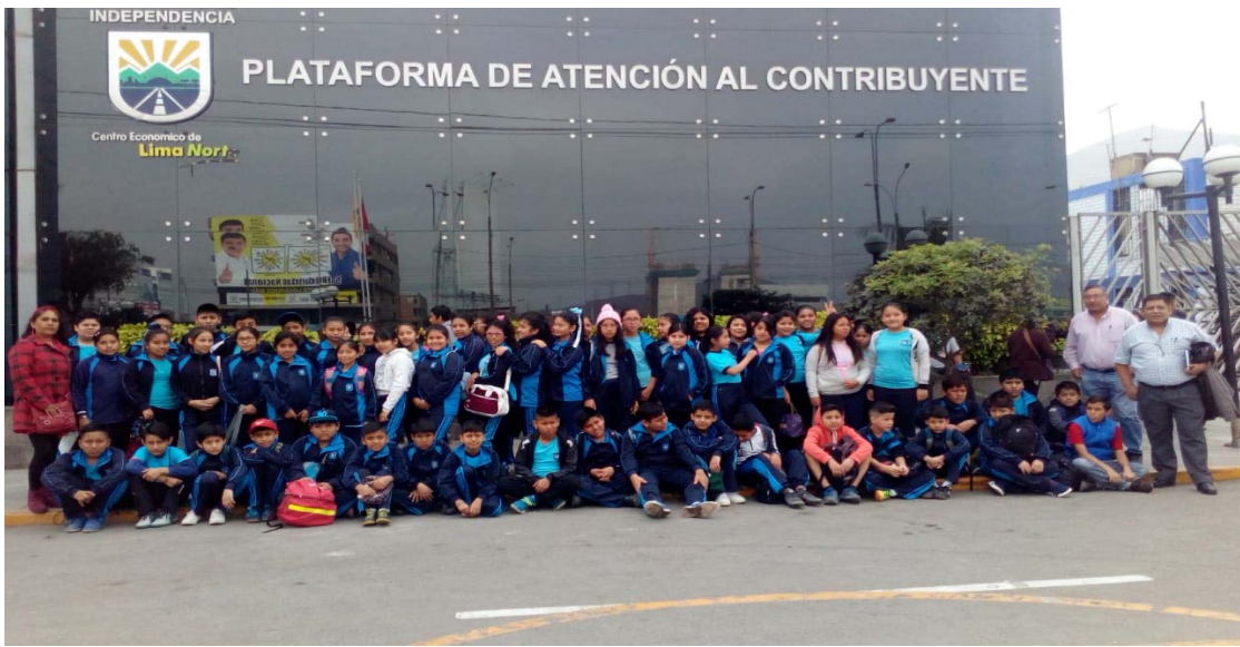
PROMOTORES AMBIENTALES ESCOLARES de la II.EE. "PATRICIA NATIVIDAD SANCHEZ"