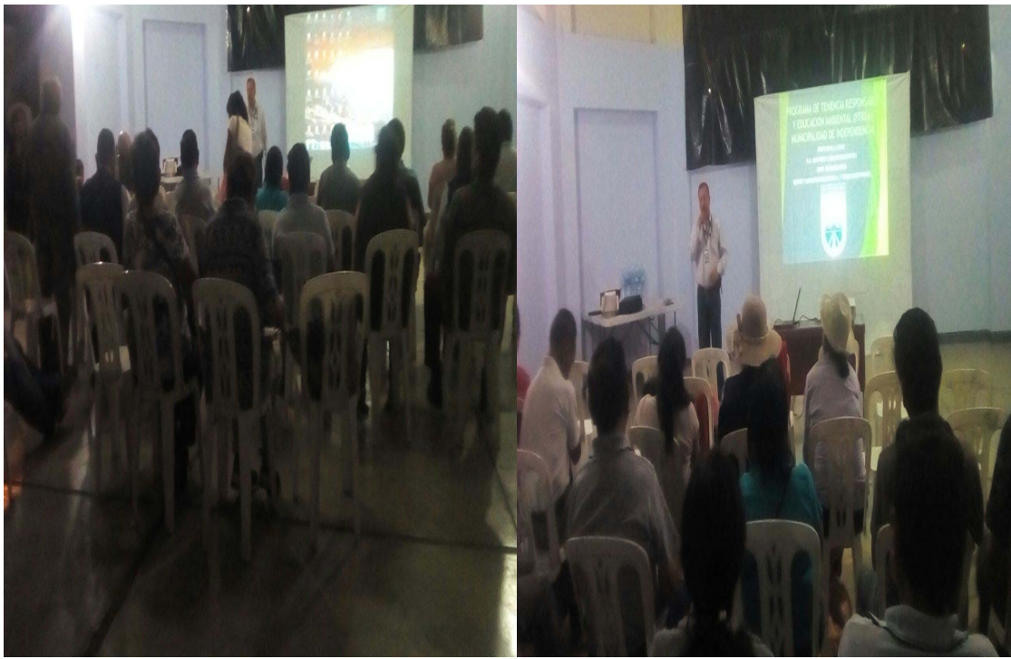
Reconocimiento PAES,PAC, RAJ.