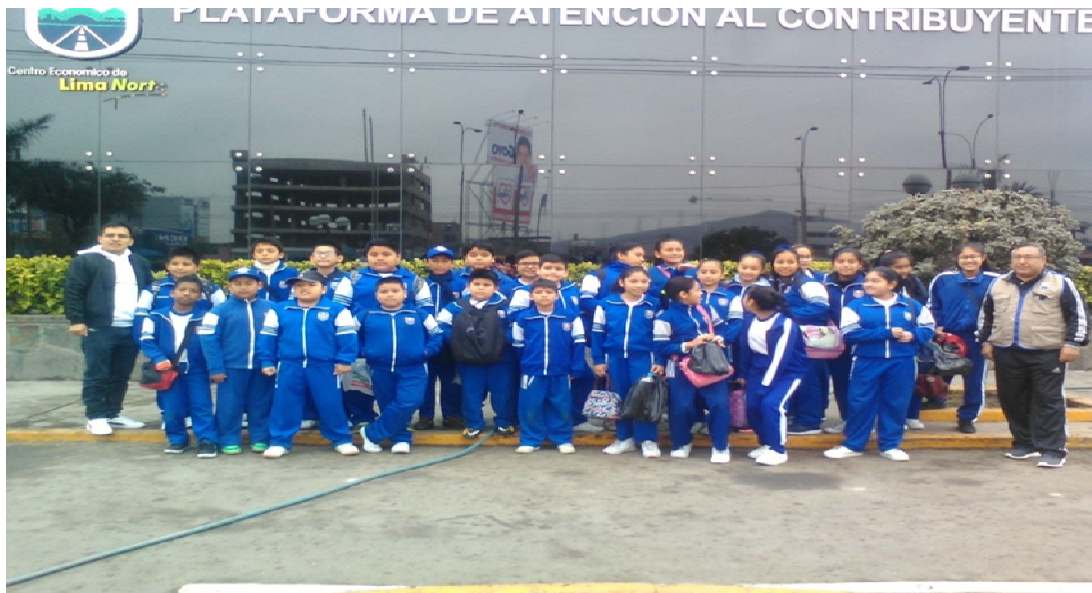
Promotores Ambientales Escolares de la II.EE. William Fulbrigh, en el Frontis de la Municipalidad de Independencia antes de visitar el Parque "Las Voces por el Clima"