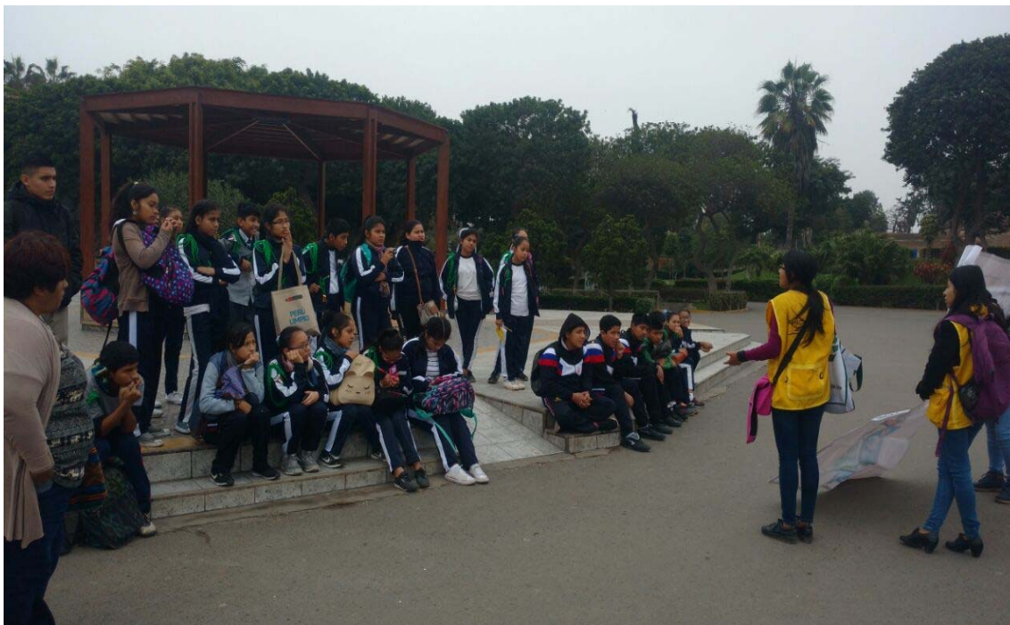
RECIBIENDO UNA CHARLA DE CAPACITACION A CARGO DE ESPECIALIASTAS DE LA MUNICIPALIDAD DE LIMA