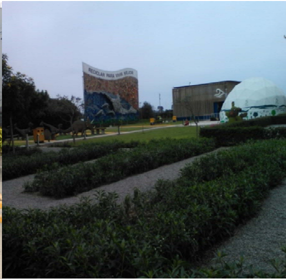
PROMOTORES AMBIENTALES ESCOLARES DE LA II.EE. MARIA AUXILIADORA DE INDEPENDENCIA, INGRESANDO AL INTERIOR DEL PARQUE "LAS VOCES POR EL CLIMA"