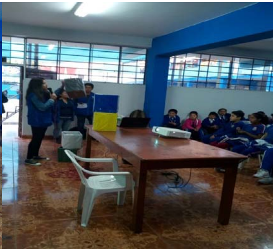
- TALLER DE EDUCACIÓN AMBIENTAL – HIDROPONÍA