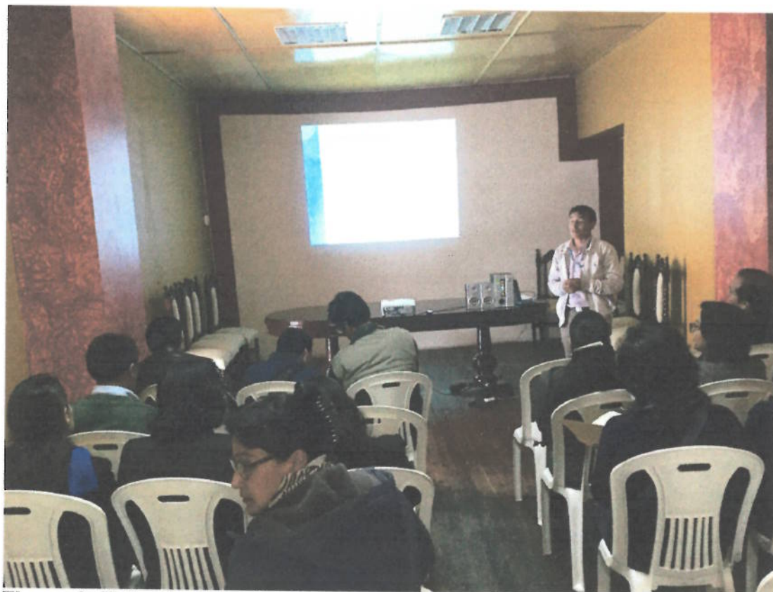
Figura 9. Taller de capacitación a las juntas vecinales sobre gestión ambiental y gestión de riesgos y desastres