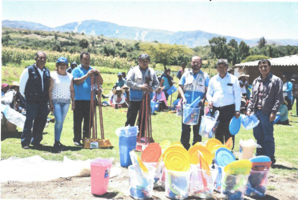
Figura 8. Entrega de incentivos proyecto "Microrellenos sanitarios" Hichabamba