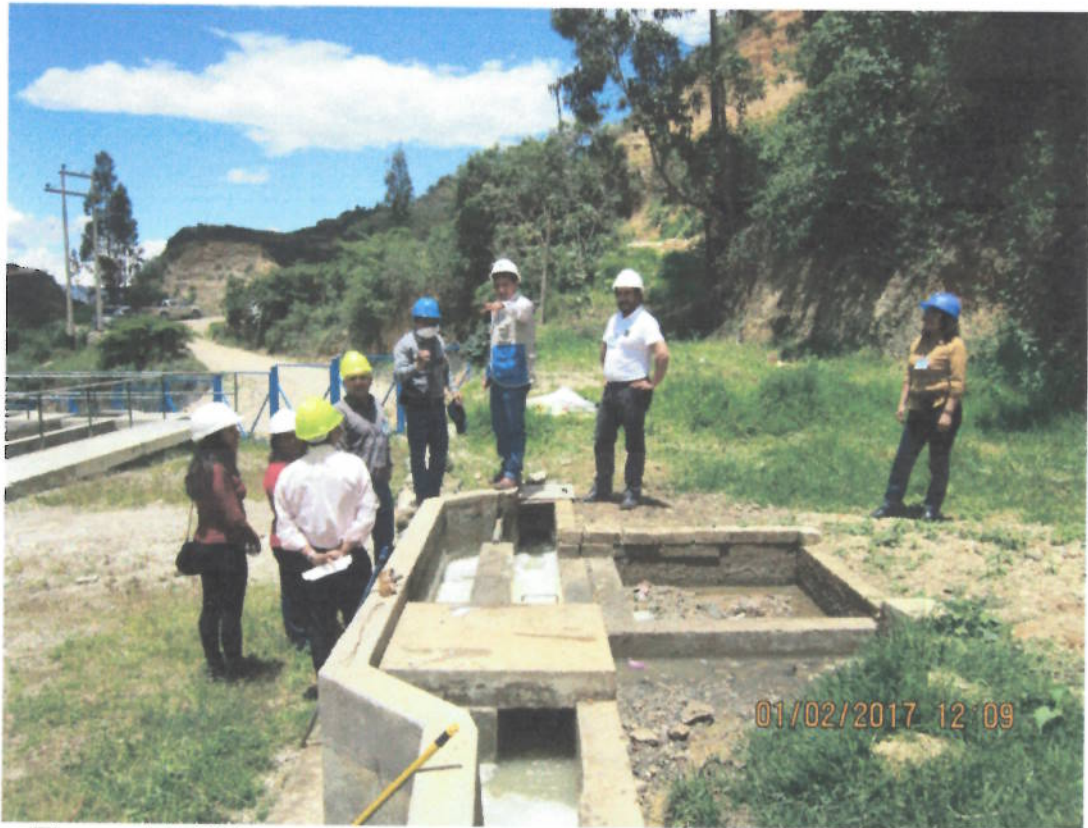
Figura 11. Visita guiada en la PTAR – Cajabamba a Alcalde, regidores y funcionarios de la Municipalidad de Hualgayoc – Bambamarca