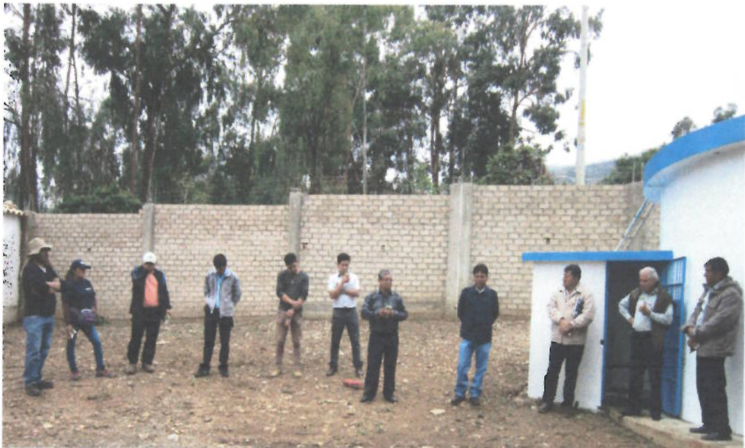
Figura 19. Encuentro de las Áreas Técnicas Municipales de Saneamiento en Cajabamba, JASS Pampa Chica