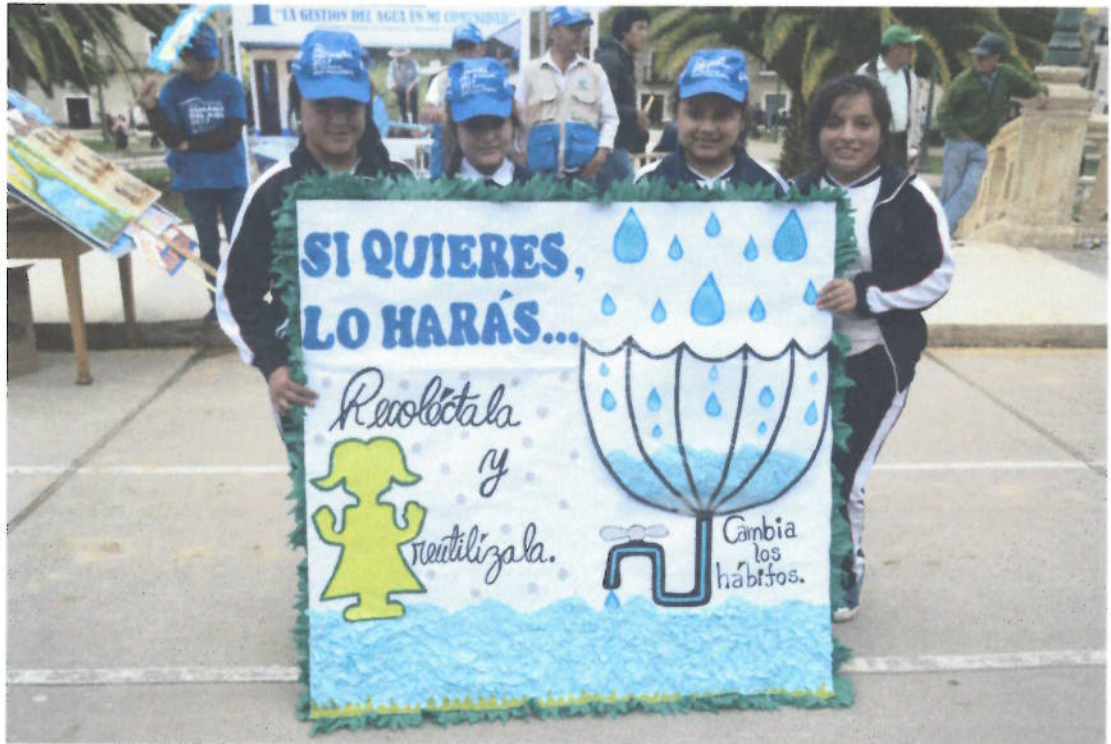
Figura 13. Desarrollo del concurso de pancartas por la Semana del medio ambiente