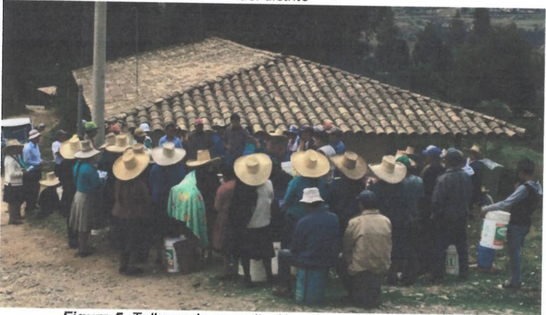
Figura 5. Talleres de capacitación a la JASS de Shitabamba