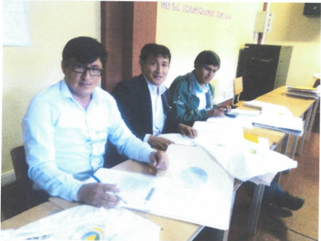
Figura 3. Jurado calificador del proyecto "Al planeta estoy salvando cuando bolsa de tela voy usando" por la I.E. Nuestra Señora del Rosario