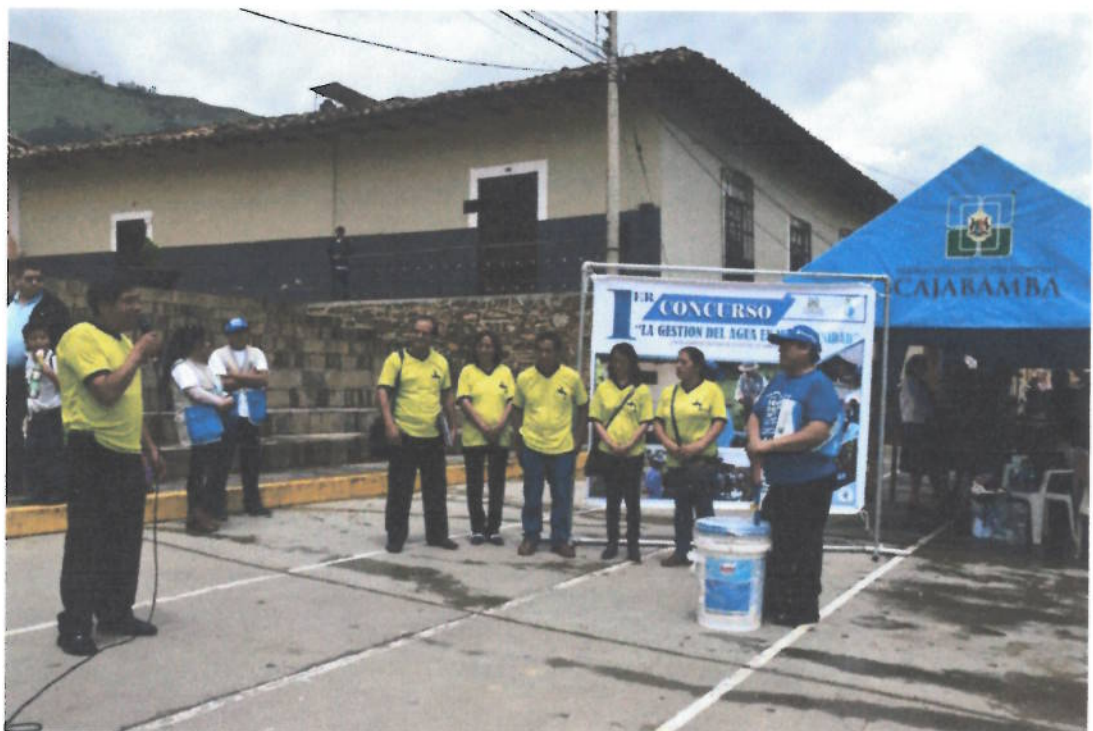
Figura 14. Desarrollo del concurso de "Buenas prácticas ambientales" con las JASS por la semana Ambiental en Cajabamba, JASS Pampa Chica