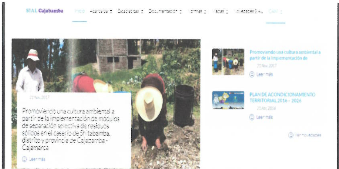
Figura 18. Portada del Sistema de Información Ambiental de la Municipalidad Provincial de Cajabamba - SIAL Cajabamba