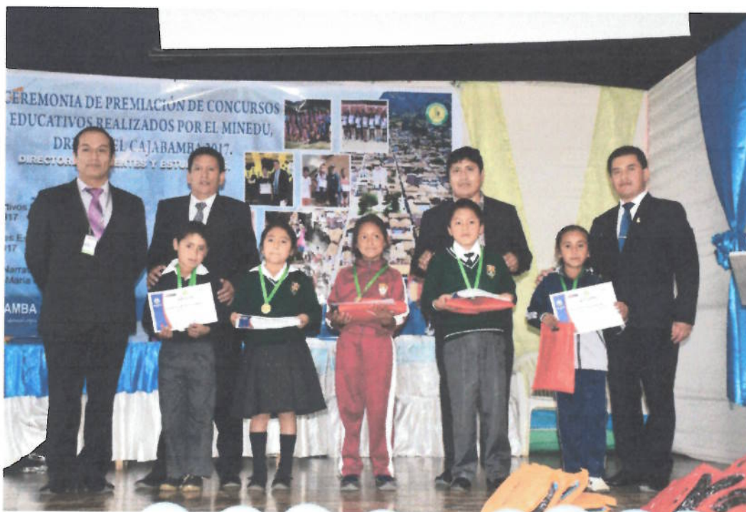
Figura 15. Premiación a las Instituciones que obtuvieron el nivel destacado en la aplicación del enfoque ambiental