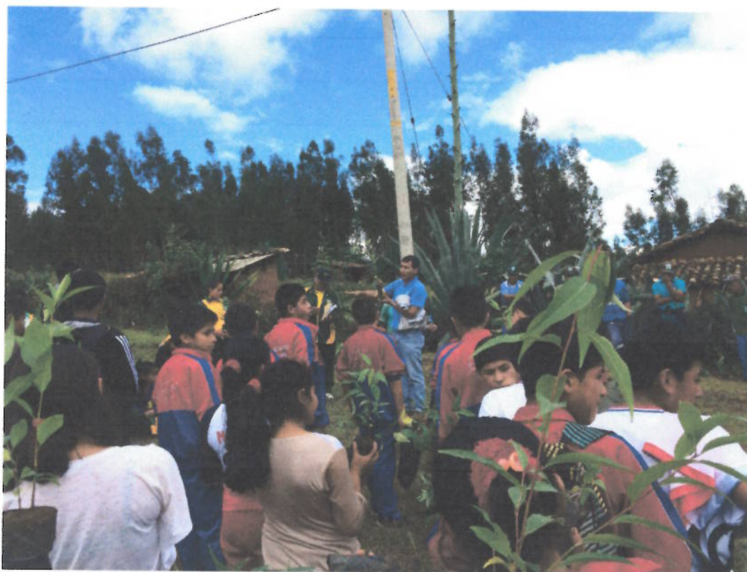
Figura 16. Caminata y sembrado de plántones de capulí (planta autóctona de Cajabamba) por el día de la Ciudadanía Ambiental