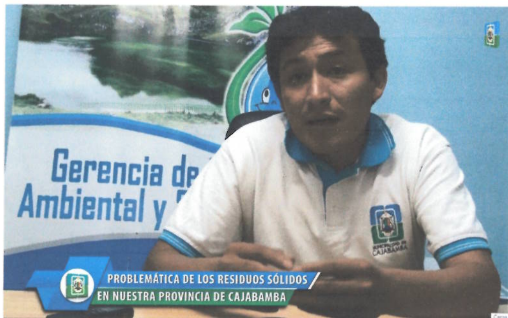
Figura 17. Entrevista al Gerente de Gestión Ambiental y Saneamiento sobre proyecto de micro rellenos sanitarios