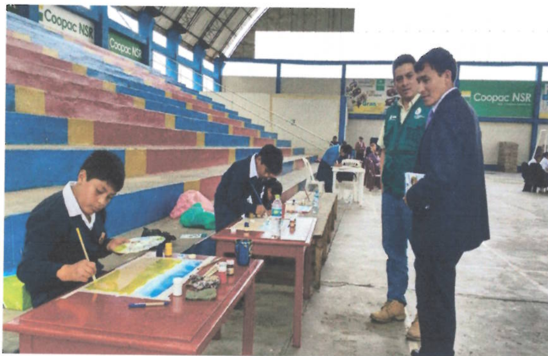
Figura 12. Desarrollo del concurso de pintura y pancartas por el día mundial del agua