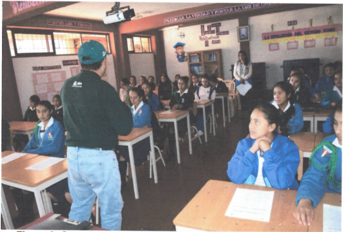
Figura 2. Capacitación a Policías ambientales escolares del distrito de Cajabamba por especialista del ALA-Crisnejas, Semana Ambiental. Junio – 2017