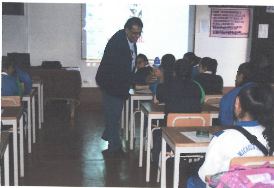
Figura 1. Capacitación a Policías ambientales escolares del distrito de Cajabamba por especialista de la UGEL, Semana Ambiental. Junio – 2017