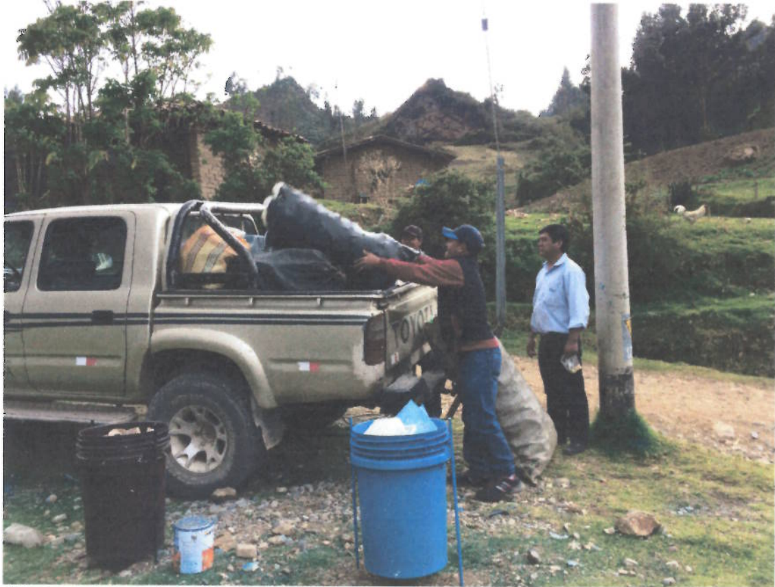
Figura 7. Recolección selectiva de residuos del proyecto "Reaprovechamiento de residuos sólidos" en Shitabamba – Cajabamba