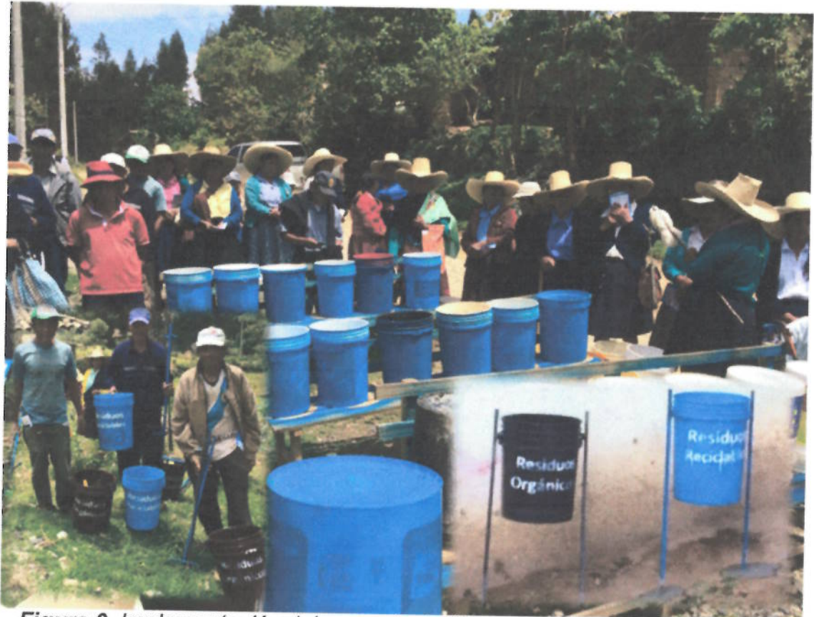
Figura 6. Implementación del proyecto de "Reaprovechamiento de residuos sólidos" en Shitabamba – Cajabamba