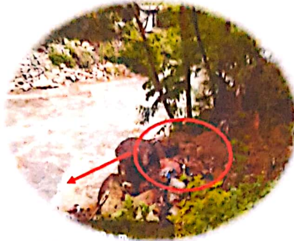
4. Contaminación Recurso Hídrico