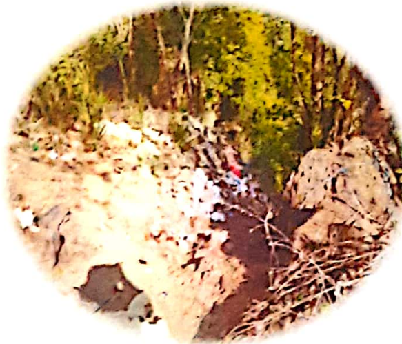
1. RR. SS /Fuente Propia