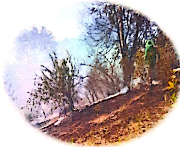
2. Incendios forestales