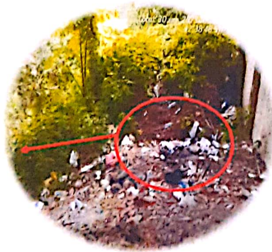
5. Contaminación de recurso hídrico