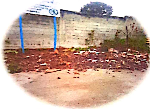
1.RR.SS /Fuente propia