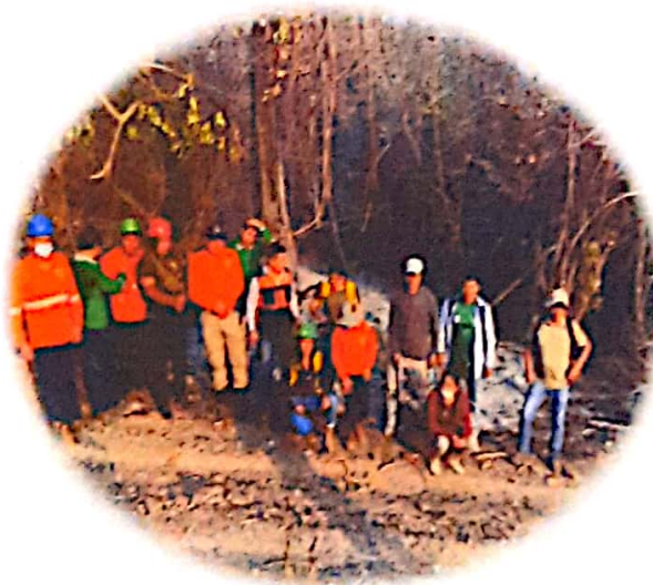
3. Incendios Forestales

OFICINA DE MEDIO AMBIENTE MUNICIPALIDAD DISTRIITAL DE ECHARATI CALLE DE LA LIBERTAD N° 1001 ECHARATI - TACNA TEL: 054 222 1111 WWW.MUNICIPALIDADDEECHARATI.GOV.PE