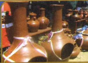
STO. DOMINGO DE LOS OLLEROS