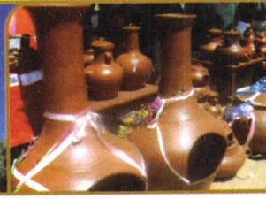
STO. DOMINGO DE LOS OLLEROS