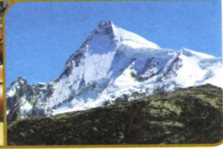
NEVADO DE PARIACACA