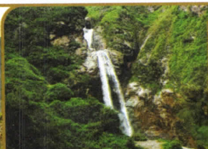
CATARATA DE ANTANKALLO