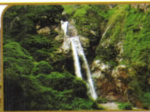
CATARATA DE ANTANKALLO