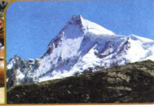
NEVADO DE PARIACACA