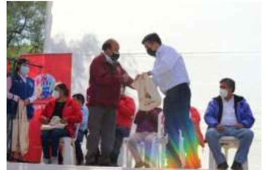
Concurso de RAEECICLA entre juntas vecinales de Cajamarca: 23 de Julio, Lugar: Plataforma la Colmena, Hora: 8:30 am