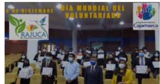
Red Ambiental Juvenil-Cajamarca Lugar: Auditorio MPC, Hora: 10. Am- Noviembre 2021

PROGRAMA MUNICIPAL EDUCCA EDUCACIÓN, CULTURA Y CIUDADANÍA AMBIENTAL