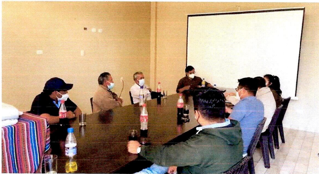
Alcalde y regidores tomando decisiones en materia ambiental