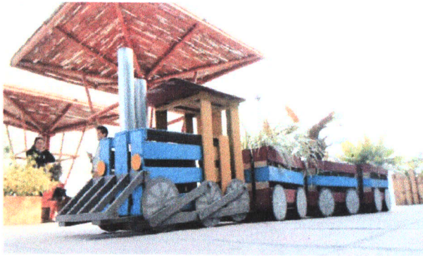
Figura 2. Reúso de latas