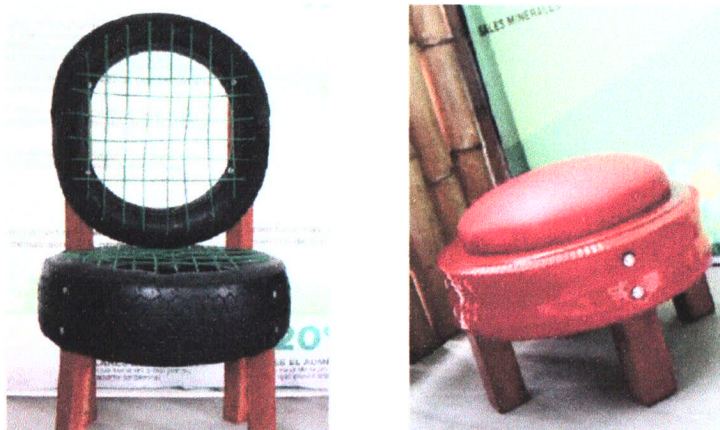
Figura 3. Asientos elaborados con llantas.