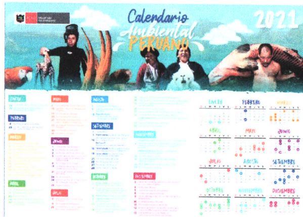
Figura 6. Calendario Ambiental Peruano