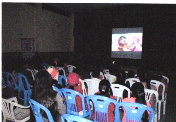
Figura 5. Narración de cuento ambiental

La emisión de películas infantiles ecologistas busca sensibilizar de manera lúdica y entretenida a los niños del distrito a fin de desarrollar su conciencia y responsabilidad ambiental respecto a sus acciones. Esta actividad se desarrollará en el auditorio municipal con los protocolos necesarios que eviten la propagación del COVID-19. Para su implementación se podrá contar con el apoyo del Comité de Damas Municipal para velar por el orden durante el desarrollo de la tarde cinematográfica y entrega de snacks saludables que mejoren la experiencia de los niños.