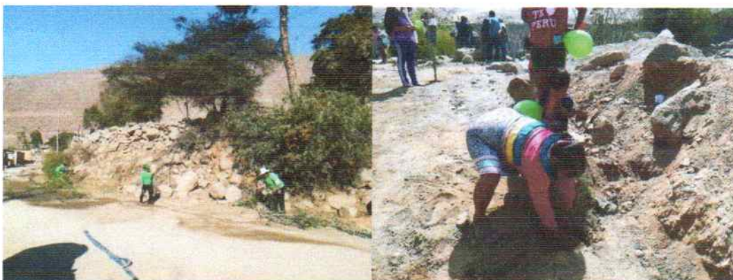
Figura: 11 Arborización en el distrito de Santa Eulalia.