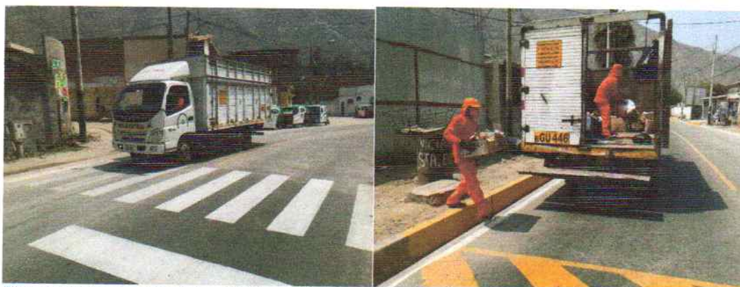
Figura: 8 Recolección de los RR.SS. en diversas calles del distrito de Santa Eulalia.