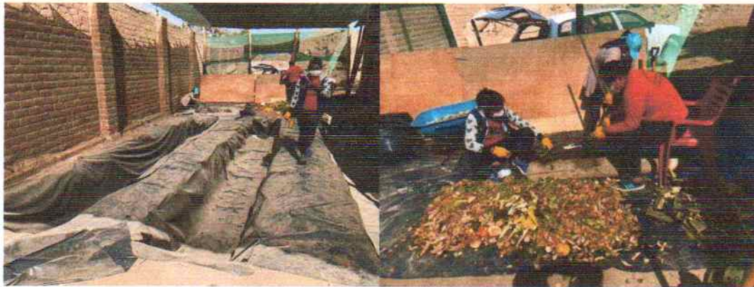
Figura: 9 Realización del compostaje con los residuos orgánicos recolectados de las viviendas