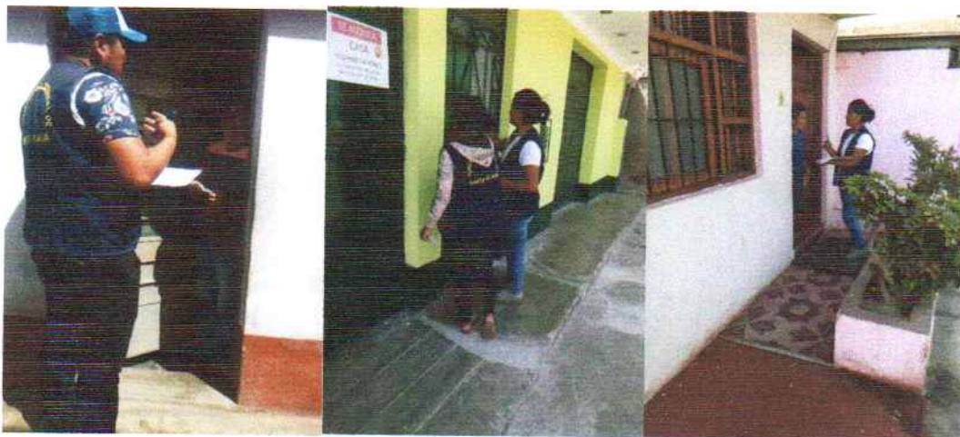
Figura: 7 Charlas de sensibilización a las poblaciones sobre el la segregación de RR.SS. en cada domicilio.

Este programa se ha venido implementando desde el año 2019 y se pretende que cada año se logre incrementar progresivamente el número de viviendas participantes y a su vez el compromiso de los habitantes para separar adecuadamente los residuos reaprovechables, no reaprovechables, orgánicos y peligrosos, desde sus domicilios según la normativa vigente, la NTP 900.058:2019; almacenarlos y entregarlos al camión recolector cuando pase por su domicilio tres veces por semana en el día y horario establecido. Los residuos Sólidos reaprovechables y no reaprovechables recolectados por el programa tienen una adecuada gestión que garantizan su correcta disposición, en cuanto a los residuos sólidos orgánicos, la municipalidad cuenta con los recursos adecuados para su valorización.