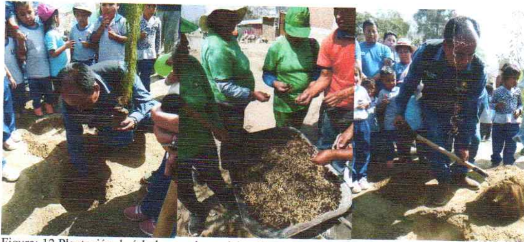
Figura: 12 Plantación de árboles con la participación de autoridades locales.