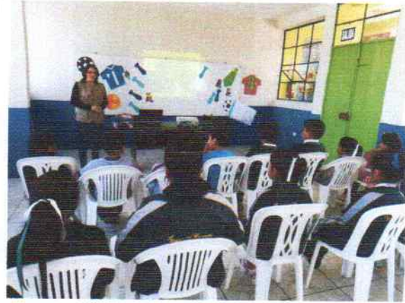
Figura: 4 Taller a la policía escolar