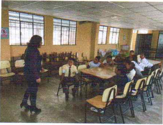
Figura: 3 Taller en Centro Educativo