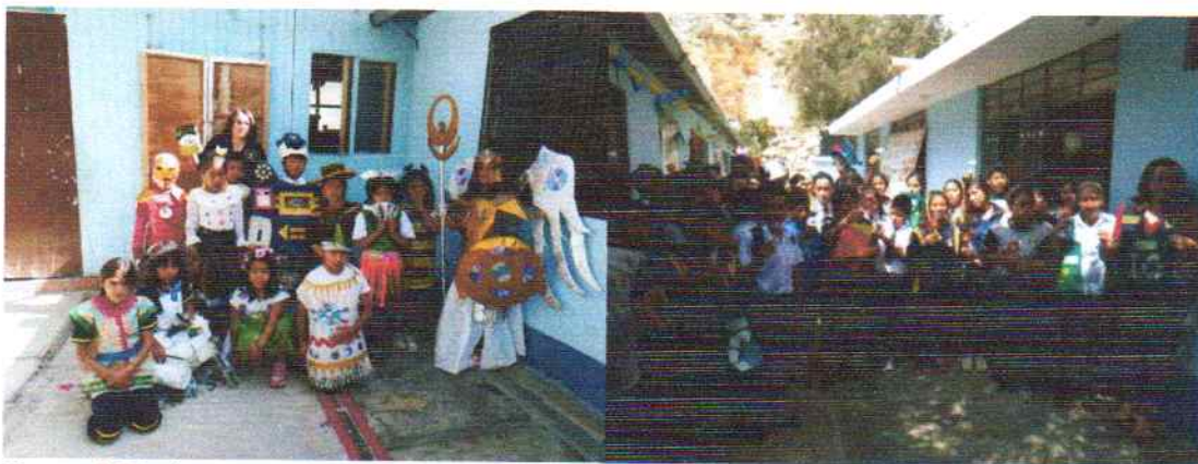
Figura: 5 Charlas acerca de segregación de RR.SS. en los colegios