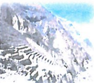
ANDENERIA DE MARPA