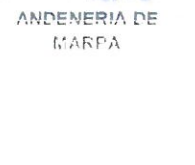
ANDENERIA DE MARPA