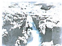
CATARATA DE SIPIA