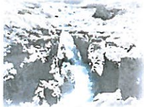
CATARATA DE SIPIA

Que, en consecuencia, y de acuerdo a lo mencionado por la Gerencia/Subgerencia.... (Unidad orgánica con competencias ambientales), se requiere la aprobación del PROGRAMA MUNICIPAL DE EDUCACIÓN, CULTURA Y CIUDADANÍA AMBIENTAL DE LA MUNICIPALIDAD DISTRITAL DE TORO (Programa Municipal EDUCCA-Toro) para el periodo 2022, siguiendo los lineamientos establecidos en el “Instructivo para la elaboración e implementación del Programa Municipal EDUCCA” del Ministerio del Ambiente.