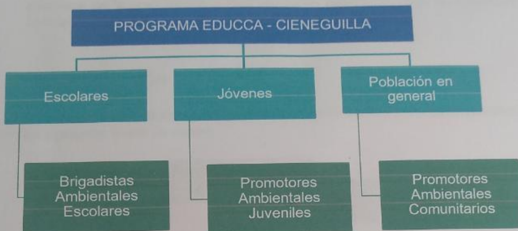
FIGURA 1.- Beneficiarios identificados del programa de educación, cultura y ciudadanía de la municipalidad distrital de Cieneguilla

Cieneguilla, Asociación de Mercados y Centro Comerciales, Asociación de Propietarios, Asociación de Recicladores, Restaurantes y Clubes Campestres.