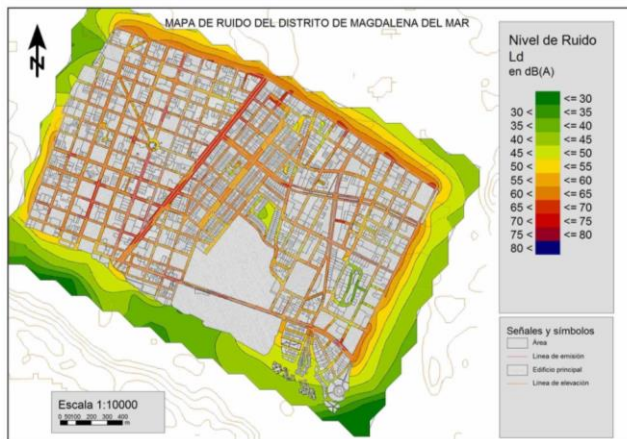
Figura 1: Mapa de ruido del distrito de Magdalena del Mar, abril 2017.

Los puntos críticos identificados en el distrito son los siguientes según Figura 1: