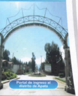
Portal de ingreso al distrito de Apata