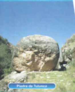
Piedra de Tulumco