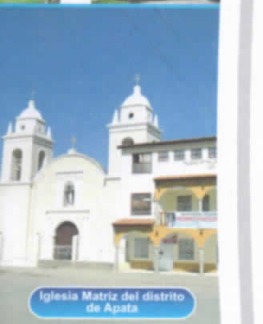
Iglesia Matriz del distrito de Apata