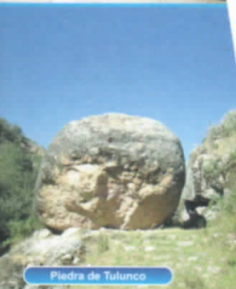
Piedra de Tulumco

entre sus lineamientos orientadores desarrollar programas de educación ambiental a nivel formal y no formal.