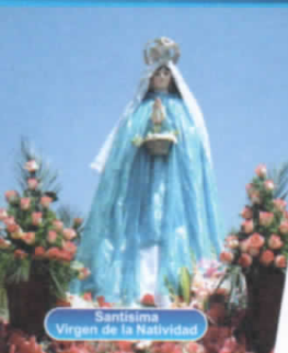
Santísima Virgen de la Natividad

Provincia de Jauja - Junín Gestión Municipal 2019 - 2022