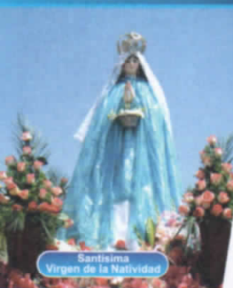
Santísima Virgen de la Natividad

Que, el artículo 127° de la Ley N° 28611, establece que el Ministerio de Educación y la Autoridad Ambiental Nacional coordinan con las diferentes entidades del Estado para la definición de la Política Nacional de Educación Ambiental teniendo