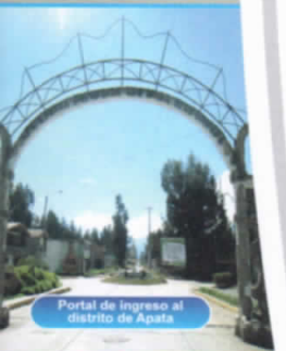
Portal de ingreso al distrito de Apata