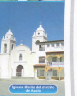
Iglesia Matriz del distrito de Apata