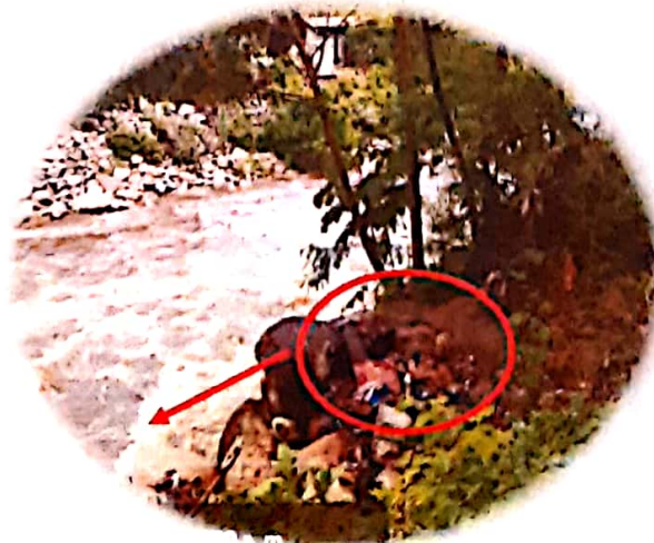
6. Contaminación Recurso Hídrico