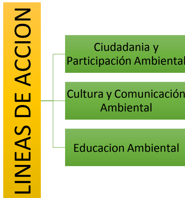
Cuadro N° Líneas de Acción

Durante el Programa Municipal EDUCCA 2021-2022 se desarrollarán diferentes actividades que irán de la mano con el Plan Nacional de Educación Ambiental 2017-2022 con el objetivo de reducir, mitigar o solucionar problemas ambientales.