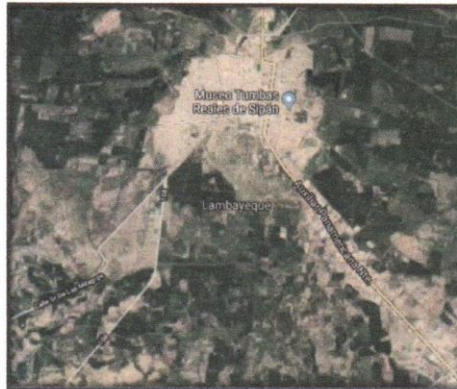
IMAGEN: Ubicación Satelital