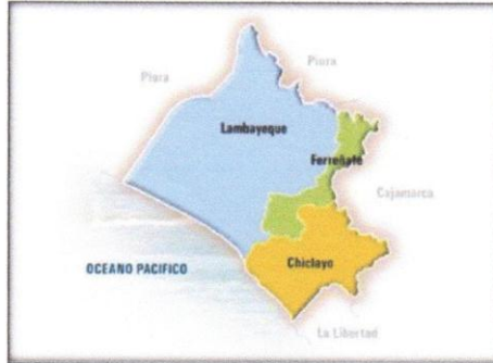
Mapa; Límites del distrito de Lambayeque