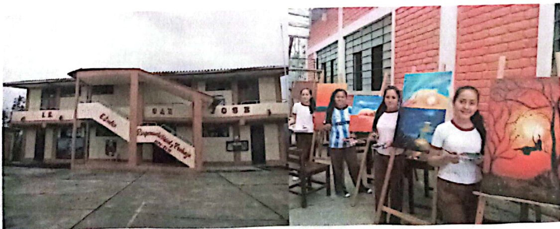
YAMANGO – MORROPON - PIURA

PROGRAMA MUNICIPAL EDUCCA EDUCACIÓN. CULTURA Y CIUDADANÍA AMBIENTAL