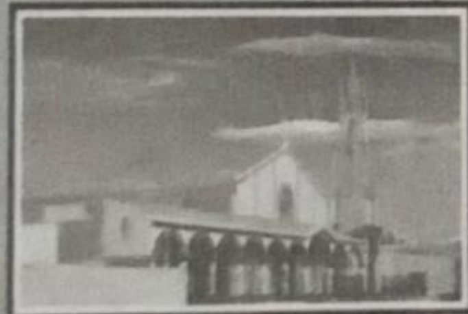
IGLESIA "INMACULADA CONCEPCIÓN DE MARÍA" "Ciudad eternamente Católica"