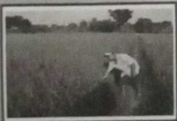
FERTILIDAD DE NUESTRAS TIERRAS Nuestra Economía está basada en la agricultura