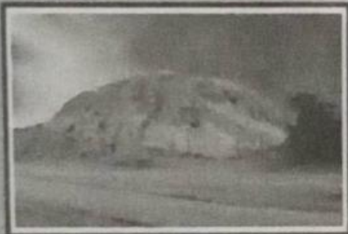
HUACA LA PAVA Pirámides Arqueológicas en las caserías la Pava Soleada, Huaca de Toro y Pueblo Nuevo