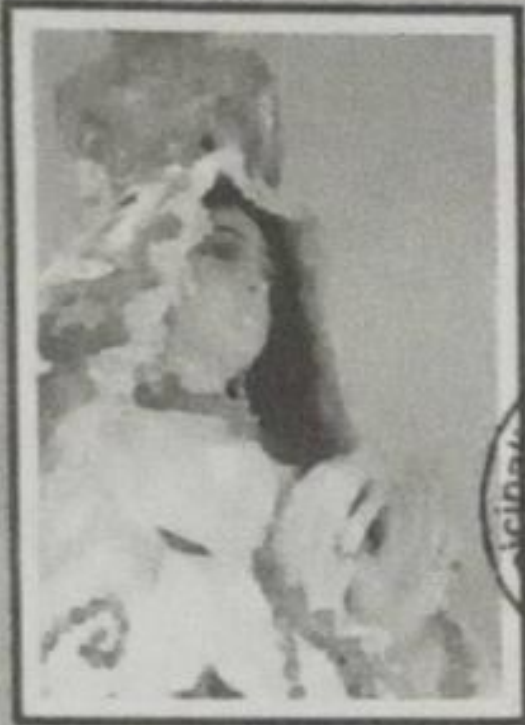
INMACULADA CONCEPCIÓN DE MARÍA Patrona de Nuestro Distrito