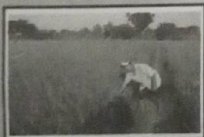
FERTILIDAD DE SUS TIERRAS Muestra Economía esta basada en la agricultura