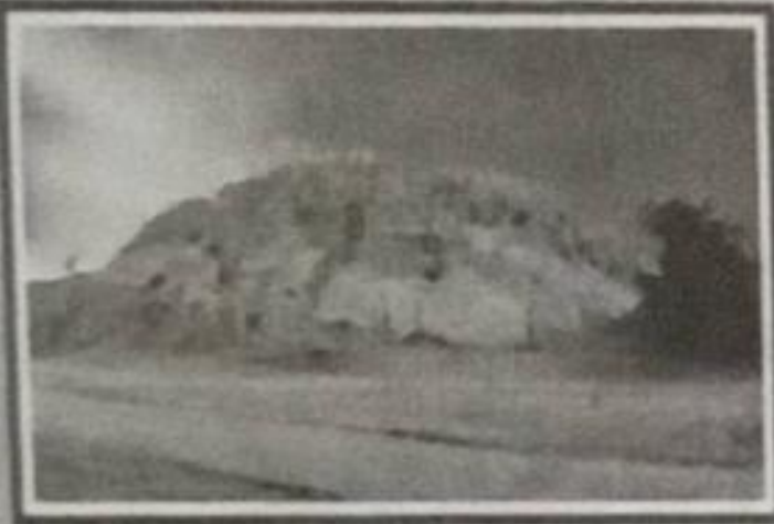
HUACA LA PAVA Pirámides Arqueológicas en los caseríos la Pava Solecape, Huaca de Toro y Pueblo Nuevo.