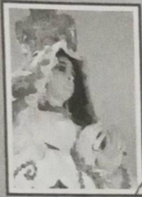
INMACULADA CONCEPCIÓN DE MARÍA Patrona de Nuestro Distrito