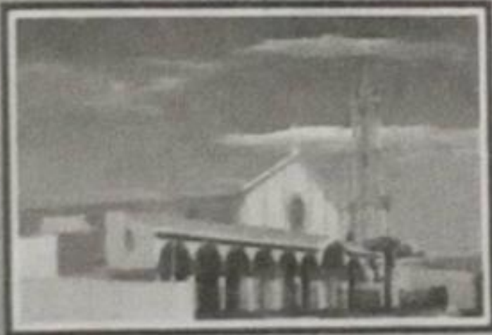
IGLESIA "INMACULADA CONCEPCIÓN DE MARÍA" "Ciudad eternamente Católica"