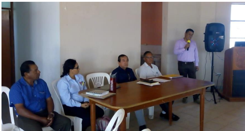
Taller de presentación del Programa EDUCCA LOS ORGANOS 2019-2022

Antes de finalizado el periodo de cada año, se realizará una evaluación ex-post del Plan de trabajo, a fin de plantear la propuesta del año siguiente.