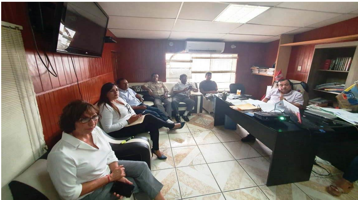
Alcalde y Regidores reunidos para aprobar el Programa Municipal EDUCCA LOS ORGANOS 2019-2022