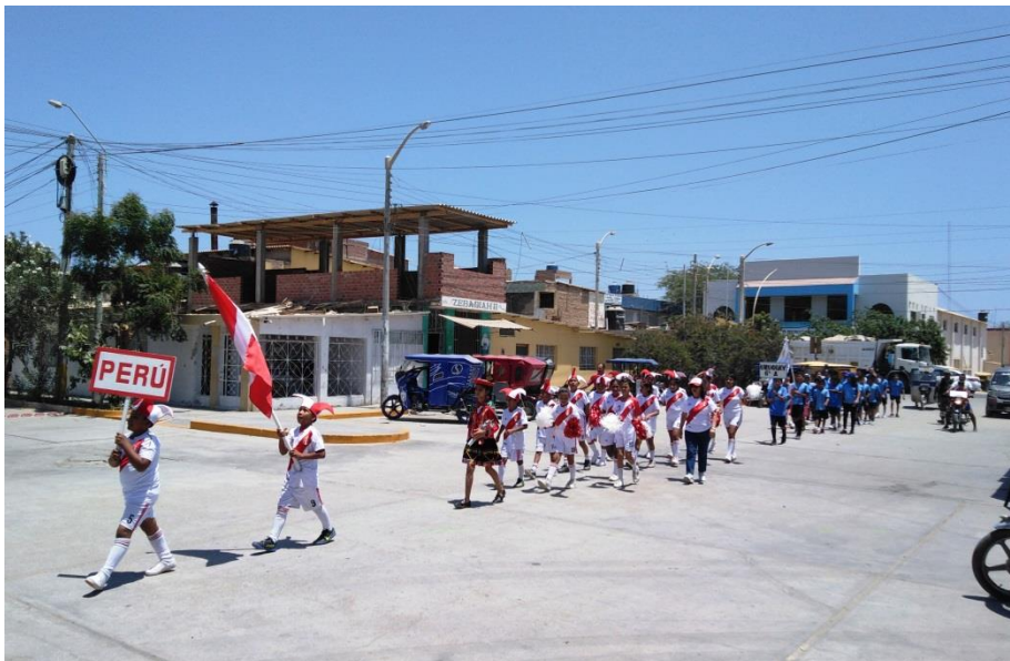
Estudiantes de diversas Instituciones Educativas del Distrito de Los Órganos