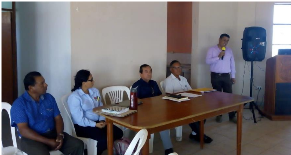
Avances de la Gestión Ambiental en el Distrito de los Órganos