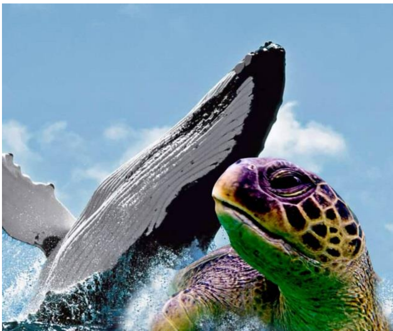
DISTRITO DE LOS ORGANOS PARAISO ECOLOGICO DE BALLENAS Y TORTUGAS