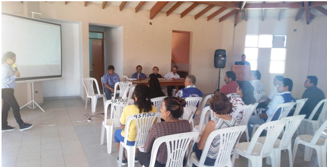
Presentación del Programa Municipal EDDUCCA Ministerio del Ambiente