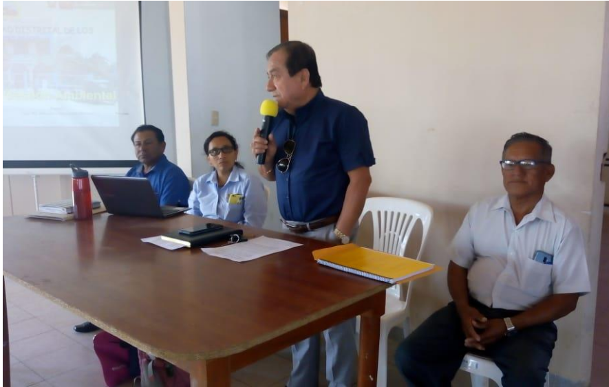
Palabras de Bienvenida del Alcalde al Programa EDUCCA LOS ORGANOS