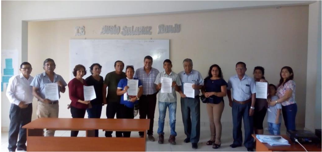
Reconocimiento del Grupo Técnico de Educación, Cultura y Ciudadanía Ambiental de los Órganos.