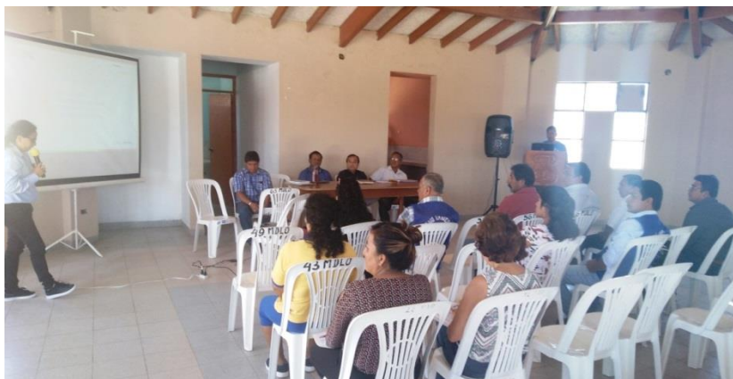
Presentación del Programa EDUCCA – Ministerio del Ambiente

Para ello, la municipalidad distrital de los Órganos, utilizara mecanismos formales, fortalecer capacidades específicas, estimular y facilitar la intervención activa y responsable de la ciudadanía en las actividades, así como su participación en las decisiones ambientales de la localidad. En este sentido, el Programa Municipal EDUCCA- LOS ORGANOS, orientará a promover la participación ciudadana a través de la formación promotores ambientales juveniles y promotores ambientales comunitarios.