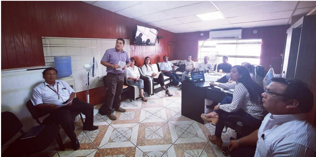
Presentación del Programa Municipal EDUCCA LOS ORGANOS 2019-2022