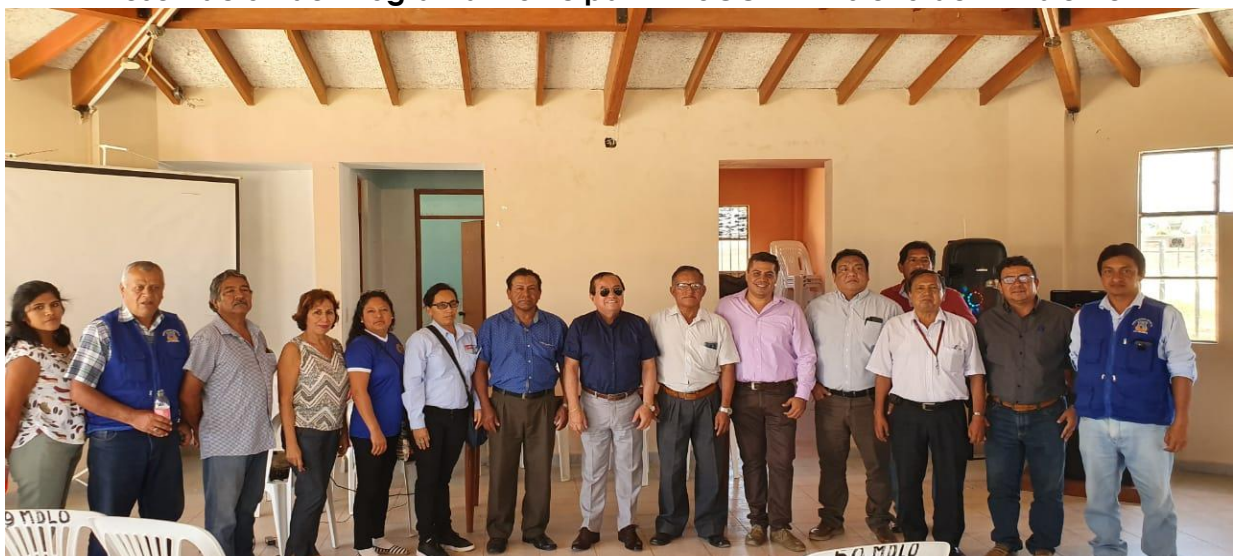
Grupo Técnico Impulsor de Educación, Cultura y Ciudadanía Ambiental del Distrito los Órganos