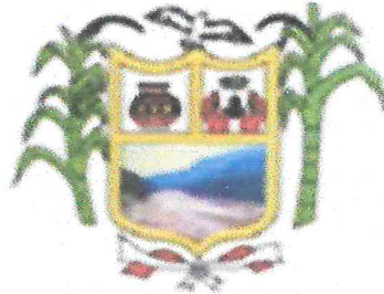
Municipalidad Distrital de CHAZUTA

Programa Municipal de Educación, Cultura y Ciudadanía Ambiental de la Municipalidad Distrital de Chazuta 2019 – 2022