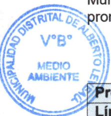
Cuadro N° 01: Líneas de Acción del Programa Municipal EDUCCA al 2022

El desarrollo de ciudadanía ambiental comprende la promoción de deberes y derechos ambientales, del cambio de comportamiento y la adopción de prácticas ambientales apropiadas y principalmente, de la participación de las personas en la mejora ambiental. Para ello, la Municipalidad Distrital de Alberto Leveau, facilitara la intervención en las decisiones de los promotores ambientales juveniles y promotores ambientales comunitarios.