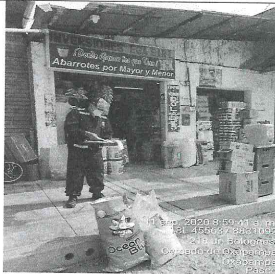
Foto N° 01: Residuos sólidos aprovechables mezclados con residuos no aprovechables encontradas en la visita