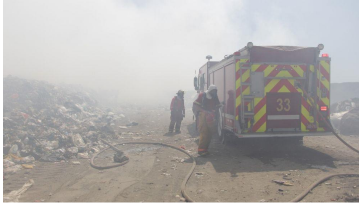
Incendio en el botadero en la provincia de Santa – Ancash, de fecha 21.07.2019