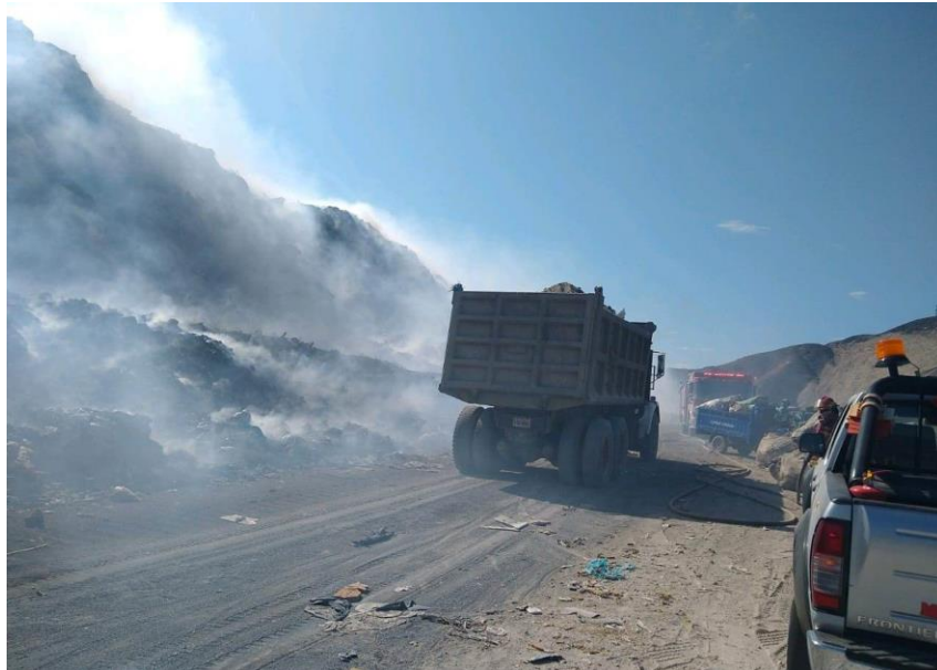
Incendio en el botadero en la provincia de Santa – Ancash de fecha 21.07.2019

Es usual que se presenten bocanadas de vapor de agua sobre la zona apagada. Si no hay llama y se comprueba que solo es vapor de agua, es mejor dejarla salir para aliviar las presiones en el interior de la basura.