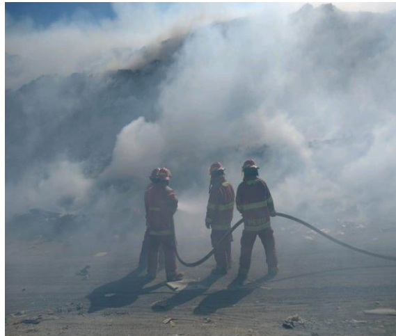
Incendio en el botadero en la provincia de Santa – Ancash de fecha 21.07.2019