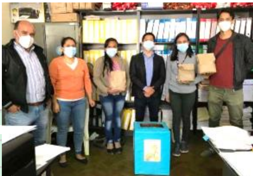
Figura N° 7: Capacitación e incentivo para el reciclaje de los residuos sólidos generados en las oficinas del personal de la Municipalidad Provincial de Pacasmayo.