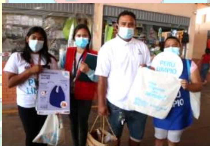
Figura N° 8: Actividad de Menos Plástico Más Vida, el cual busca la reducción del plástico de un sólo uso.

Se formó un total de 11 promotores ambientales juveniles (PAJ), a quienes se les brindó 4 capacitaciones acerca de la gestión integral de residuos sólidos y la conservación de los recursos naturales. Así mismo se realizó 2 actividades educativas orientadas a sensibilizar a los pobladores del distrito de San Pedro de Lloc.