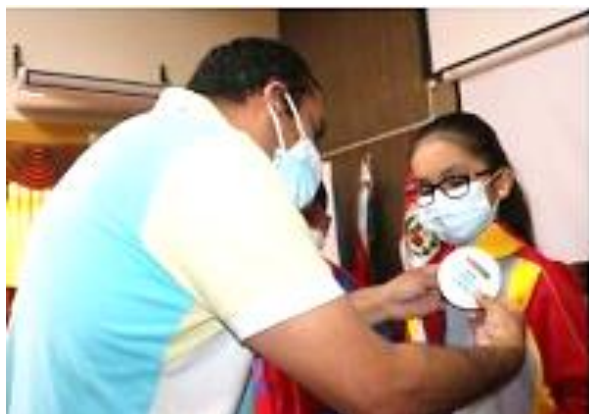
Figura N° 1: Entrega de pinos y mandiles a los promotores ambientales escolares de la MPP.