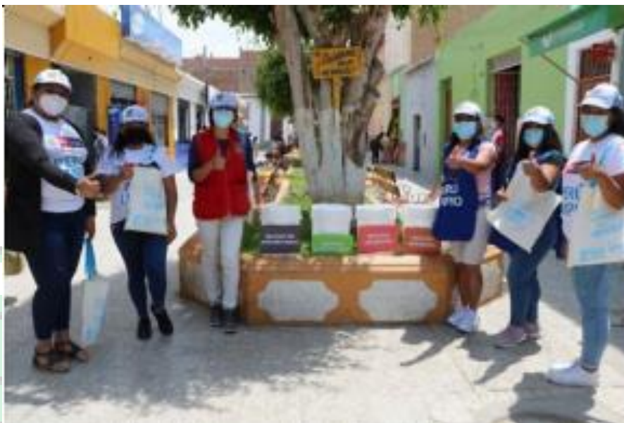
Figura N° 9: Actividad de YO SEGREGO, en el cual se les enseña a los pobladores sobre la segregación a través de juegos dinámicos.