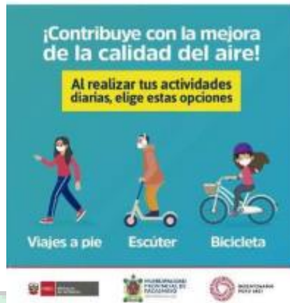
Figura N° 4: Contenido ambiental difundido en la página de Facebook oficial de la municipalidad como parte de las campañas virtuales programadas.