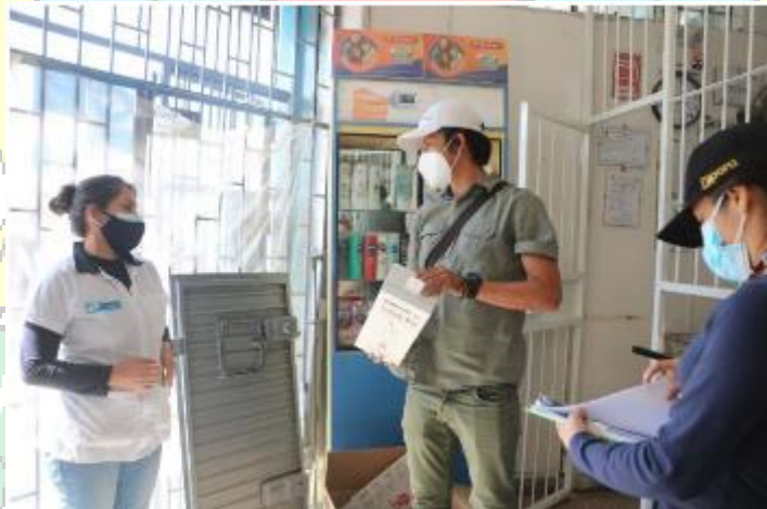
Figura N° 6: Campaña de educación ambientales, sobre la adecuada segregación de sus residuos sólidos en diversos comercios del distrito.

En el marco de Ecoeficiencia en instituciones públicas, se capacitó a las diversas áreas acerca de la adecuada segregación de sus residuos generados en oficina, a fin de promover la cultura de reciclaje en la Municipalidad Provincial de Pacasmayo.