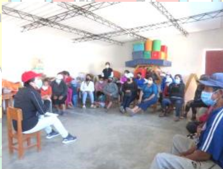
Figura N° 10: Capacitación dirigida a los PAC sobre la reducción de los plásticos de un solo uso.

Se acreditó a 15 promotores ambientales comunitarios (PAC), a quienes se les brindó capacitaciones presenciales sobre la valorización de residuos orgánicos y la reducción del plástico de un solo uso.