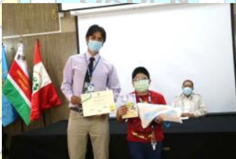
Figura N° 3: Entrega de certificados a los promotores ambientales escolares por su participación en el Programa EDUCCA.