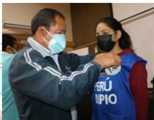
Figura N° 2: Entrega de pinos y mandiles a los promotores ambientales escolares.