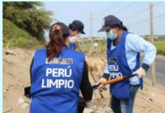
Figura N° 5: Campaña de limpieza en el sector Amauta con el apoyo de los promotores ambientales juveniles, a fin de dar el ejemplo en el cuidado del medio ambiente