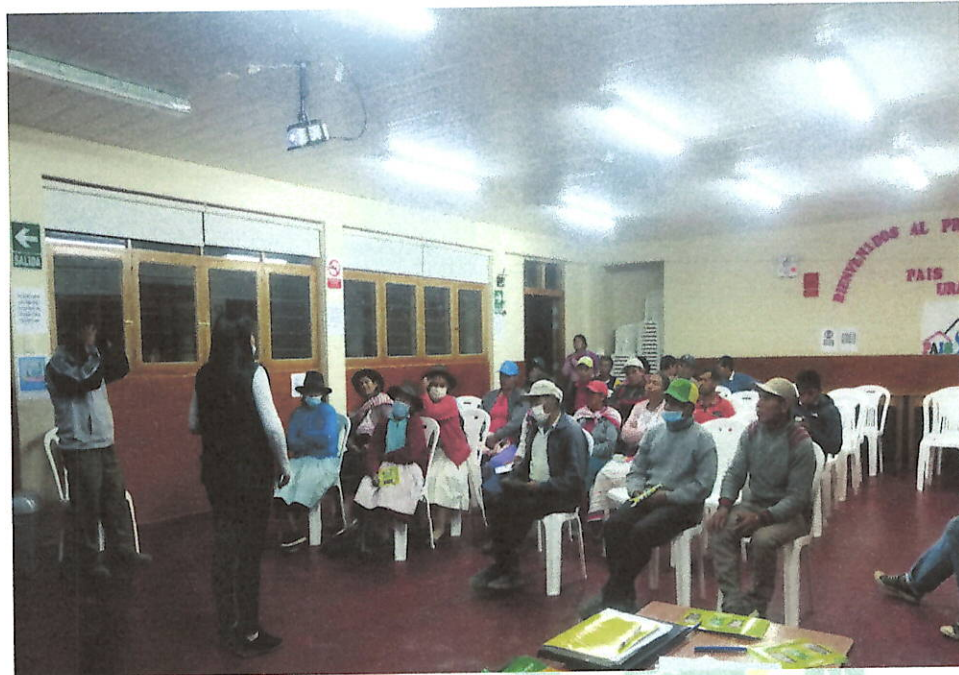
Fotografía 05. Formación de promotores ambientales comunitarios