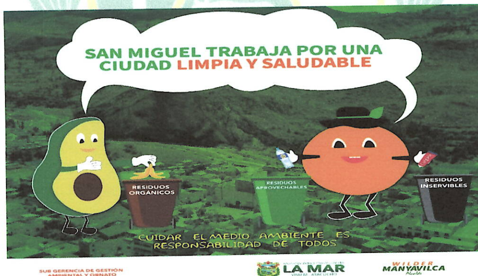
Fotografía 03. Diseño e implementación de campañas informativas y eventos Ambientales virtuales, semipresenciales y presenciales

Mediante las campañas informativas ambientales es posible informar a la ciudadanía sobre las acciones que se vienen desarrollando en el ámbito municipal y sobre los roles, deberes y derechos de los ciudadanos y ciudadanas e instituciones y organizaciones locales en el proceso de mejora ambiental. Para el desarrollo de esta actividad se realizarán capacitaciones en temas de educación ambiental, correcta segregación de residuos sólidos según la NTP 900.58. 2019. Código de colores para almacenamiento de residuos sólidos, importancia de las 3 R, consumo responsable de plásticos de un solo uso y envases de Tecnopor y Jornada de sensibilización a las viviendas del distrito de San Miguel sobre la correcta segregación de los residuos sólidos y Jornada de capacitación dirigida a las comunidades y centros poblados del distrito de San Miguel sobre la correcta segregación de los residuos sólidos, como meta para esta actividad se tiene 02 campañas informativas realizadas, 250 personas alcanzadas por publicación en redes sociales, 08 flyer, 02 videos generados, 250 horas de perifoneo, 04 horas de difusión radial, capacitación a la población y 280 personas que participan en eventos, se utilizarán diferentes recursos entre materiales como afiches, trípticos, flyers, banners y promotores ambientales para realizar las reuniones de capacitación.