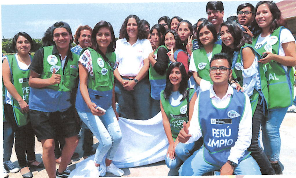
Fotografía 04. Formación de promotores ambientales juveniles