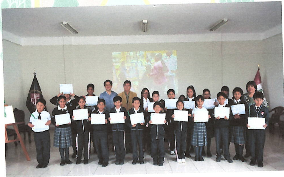
Fotografía 01. Formación de promotores ambientales escolares en las Municipalidades.

Para el desarrollo de esta actividad las Instituciones Educativas a participar en el Programa Municipal EDUCCA, trabajaran de manera articulada con la Unidad de Gestión Educativa Local de la provincia de La Mar- San Miguel, cuya meta es contar 02 Instituciones Educativas que participan en el Programa Municipal EDUCCA, 20 PAEs acreditados, 02 charlas y/ o talleres dirigido a los PAE, 05 docentes capacitados , para lograr implementar la actividad se utilizarán diferentes recursos entre materiales como afiches, tripticos y promotores ambientales para realizar las reuniones de capacitación virtuales. Finalmente la actividad de formacion de promotores ambientales escolares culminará con 02 IE, 02 docentes y 05 PAE reconocidos.