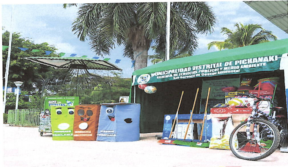
Fotografía 02. Realización de actividades ambientales en espacios públicos que eduquen ambientalmente.