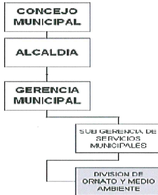
Figura 1: Estructura orgánica de la unidad responsable del Programa Municipal EDUCCA.