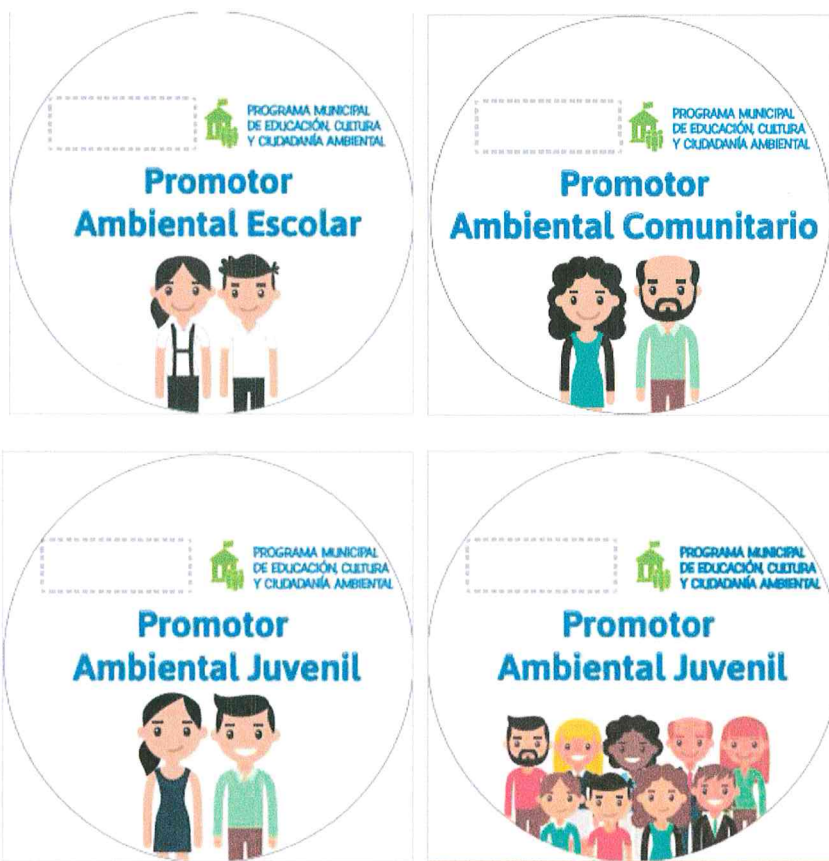
Figura 3: Pines de identificación para los promotores del Programa Municipal EDUCCA.