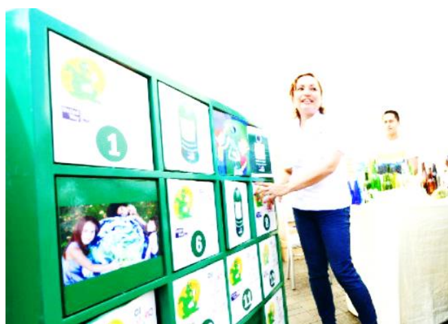
Municipalidad Distrital de Huachón