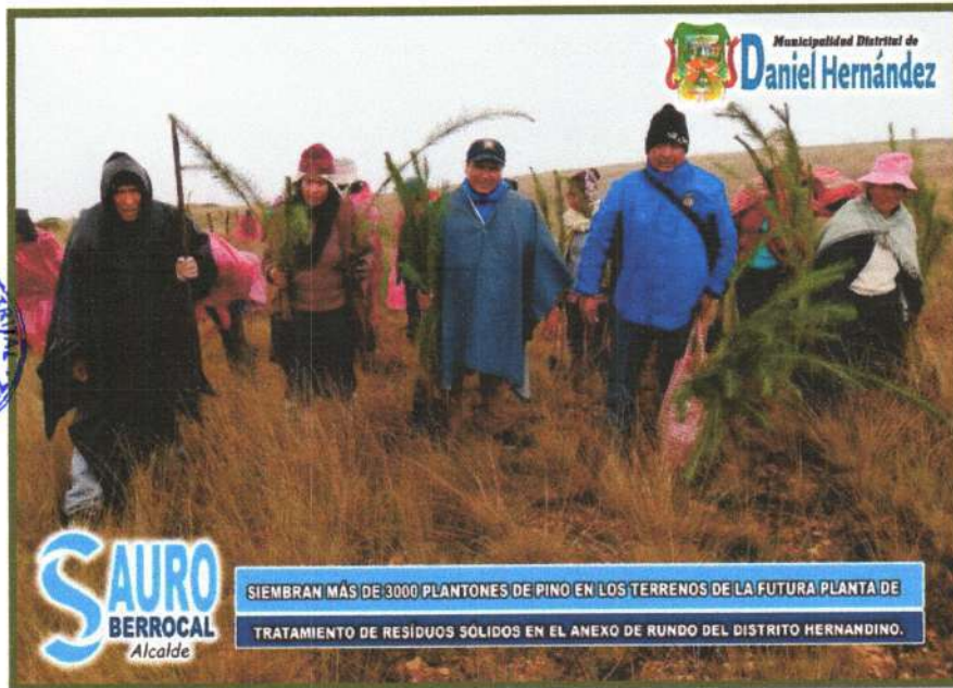
SIEMBRAN MÁS DE 3000 PLANTONES DE PINO EN LOS TERRENOS DE LA FUTURA PLANTA DE TRATAMIENTO DE RESÍDUOS SÓLIDOS EN EL ANEXO DE RUNDO DEL DISTRITO HERNANDINO.

Se realizará Concurso de la campaña Reúsa, Recicla y Reutiliza (3R).