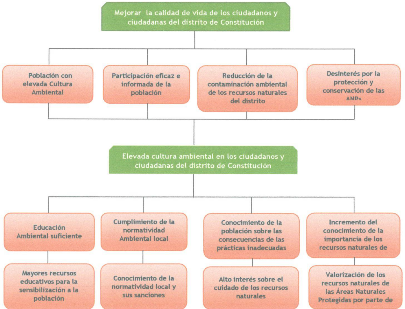
Gráfico 02: Identificación de medios y fines