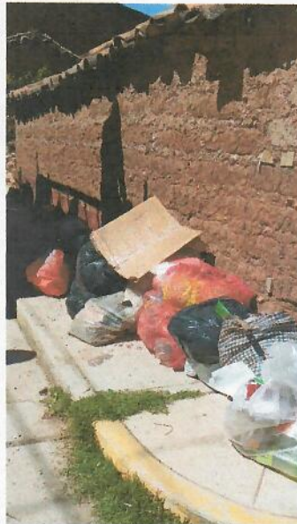
Ilustración 2, residuos sólidos municipales sin segregar