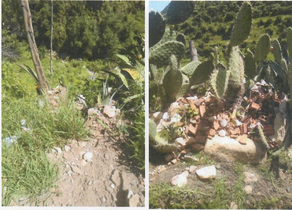
Ilustración 3: El Río Seqses Huaycco contaminada por pobladores de Carapo, está ubicado en la misma comunidad.