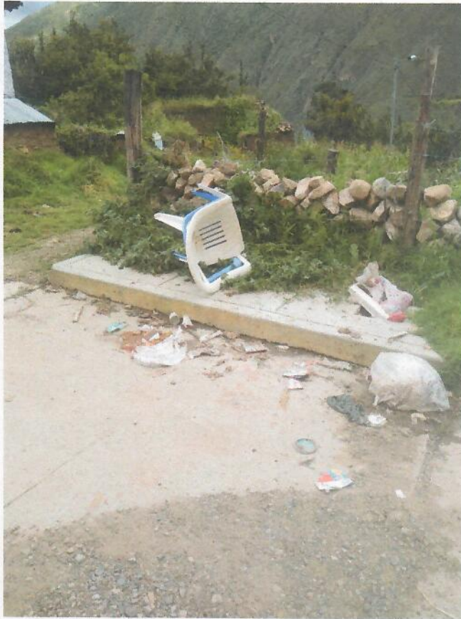
Ilustración 1: calles con restos de rr.ss.