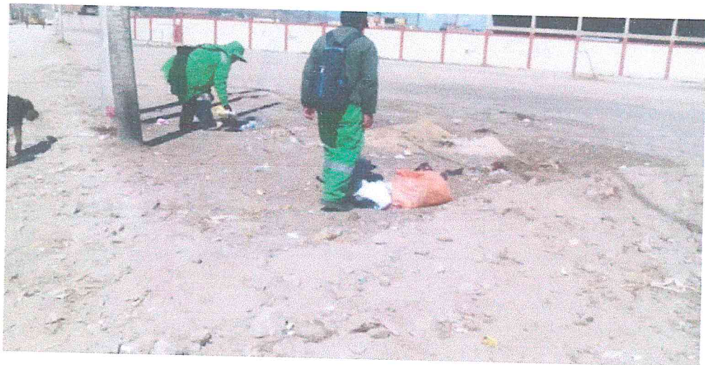
PUNTO CRITICO 8: AV. CIRCUNVALACION/AV. MARINA