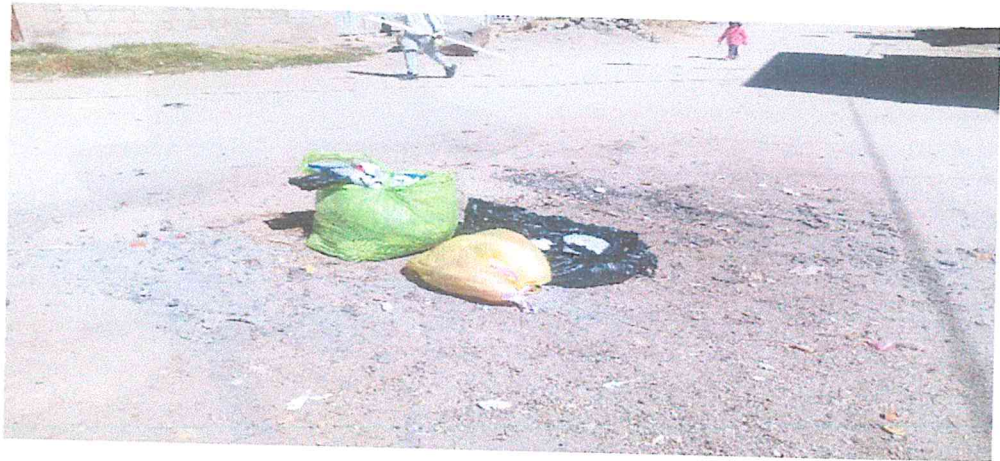
PUNTO CRITICO 7: JR. ABRAHAM VALDELOMAR / JR. SCORZA