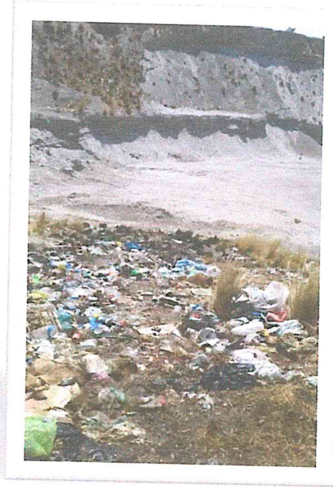
PUNTO CRÍTICO 1: CRUZ PATA