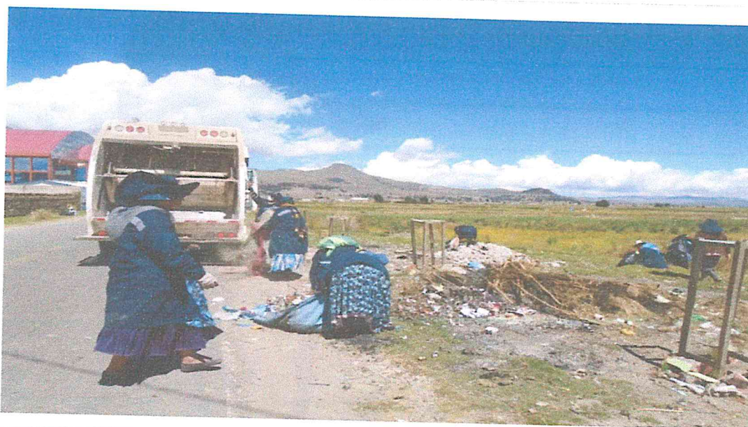
PUNTO CRITICO 5: AVENIDA PANAMERICANA