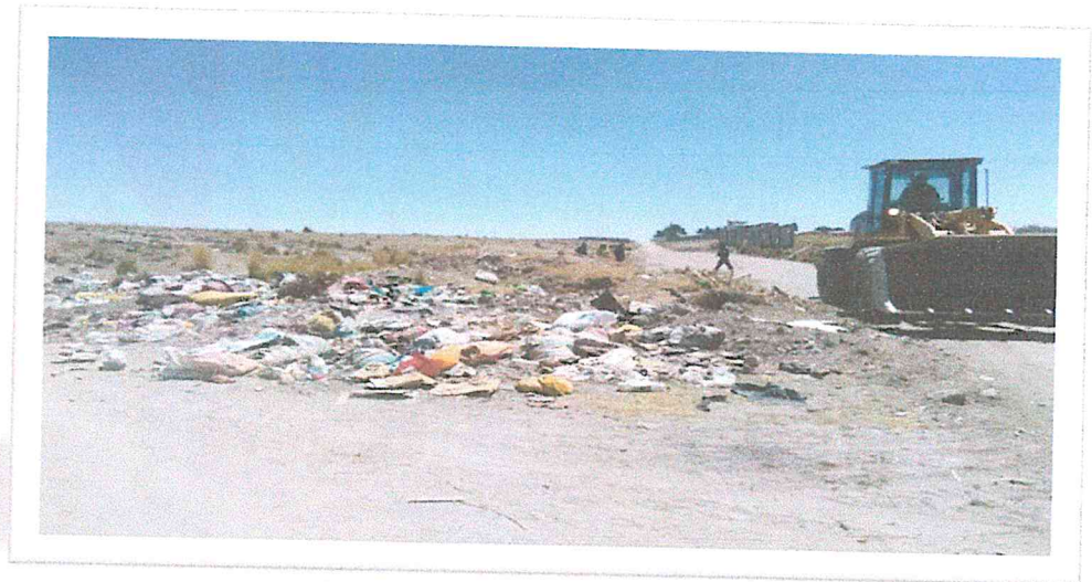
PUNTO CRITICO 2: ALTO FLORIDA