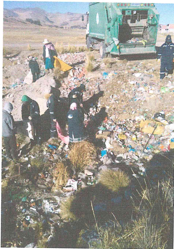
PUNTO CRITICO 4: ALTO ALIANZA