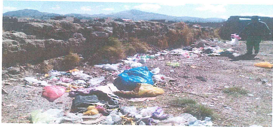
PUNTO CRITICO 03: AV. CIRCUNVALACION / JR. HUASCAR