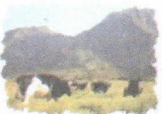
Pampas de Parihuanás