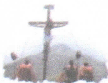
Celebración Semana Santa