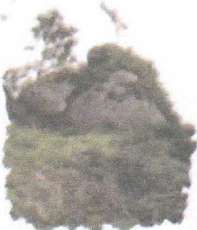
Cruz Cerro Puñuño