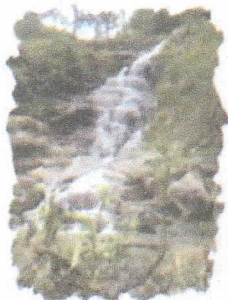
Cataratas Naranjo de Guayaquil

Que, los artículos 73° y 82° de la Ley Orgánica de Municipalidades N.° 27972, otorgan competencias y funciones a los gobiernos locales para promover la educación e investigación ambiental, incentivar la participación ciudadana en todos sus niveles; y promover la cultura de la prevención en la ciudadanía;