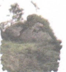
Cruz Cerro Puñño