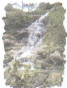
Cataratas Naranjo de Guayaquil

Que, de conformidad con lo dispuesto en el inciso 6 artículo 20 de la Ley Orgánica de Municipalidades, Ley N.º 27972, son atribuciones del Alcalde: dictar decretos y resoluciones de alcaldía con sujeción a las leyes y ordenanzas;