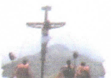
Celebración Semana Santa