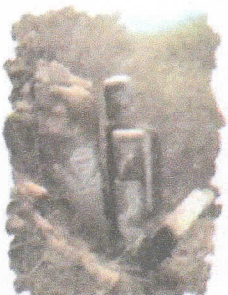
Ruinas Naranjo de Guayaquil

Que, en consecuencia, y de acuerdo a lo mencionado por la Unidad de Gestión Ambiental a través de la Subgerencia de Saneamiento y Gestión Ambiental, se requiere la aprobación del PROGRAMA MUNICIPAL DE EDUCACIÓN, CULTURA Y CIUDADANÍA AMBIENTAL DE LA MUNICIPALIDAD DISTRITAL DE FRÍAS (Programa Municipal EDUCCA - Frías) para el periodo 2021-2022, siguiendo los lineamientos establecidos en la "Guía para elaboración de Programas Municipales EDUCCA" del Ministerio del Ambiente.