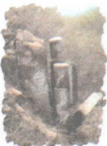
Ruínas Naranjo de Guayaquil