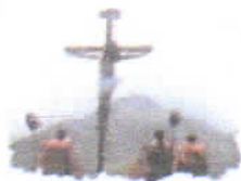
Celebración Semana Santa