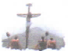
Celebración Semana Santa

Dirección: Calle Lima N° 235 - Frías - Ayabaca - Piura Teléfono: 378294 / 378535 - Fax: 378294