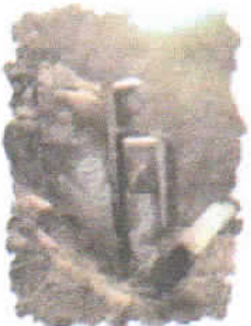
Ruinas Naranjo de Guayaquil