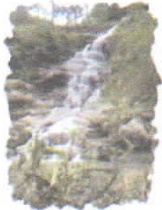
Cataratas Naranjo de Guayaquil

ARTÍCULO PRIMERO: Aprobar el Plan de Trabajo del año 2021 del Programa Municipal de Educación, Cultura y Ciudadanía Ambiental de la Municipalidad Distrital de Frías (Programa Municipal EDUCCA 2021 - 2022) el mismo que forma parte integrante de la presente Resolución.