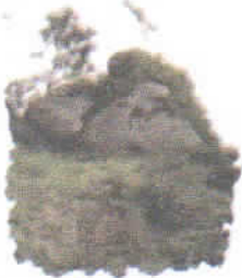
Cruz Cerro Puñuño