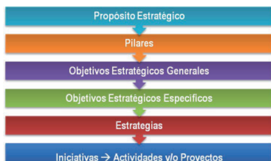
Gráfico 2: Objetivos y Estrategias del Plan Estadístico Agrario Nacional

Según este despliegue de objetivos y estrategias, se parte de definir el propósito estratégico a ser cumplido durante el periodo comprendido en el Plan Estadístico Agrario Nacional, el cual contribuye decididamente al logro de la misión y visión del SIEA.