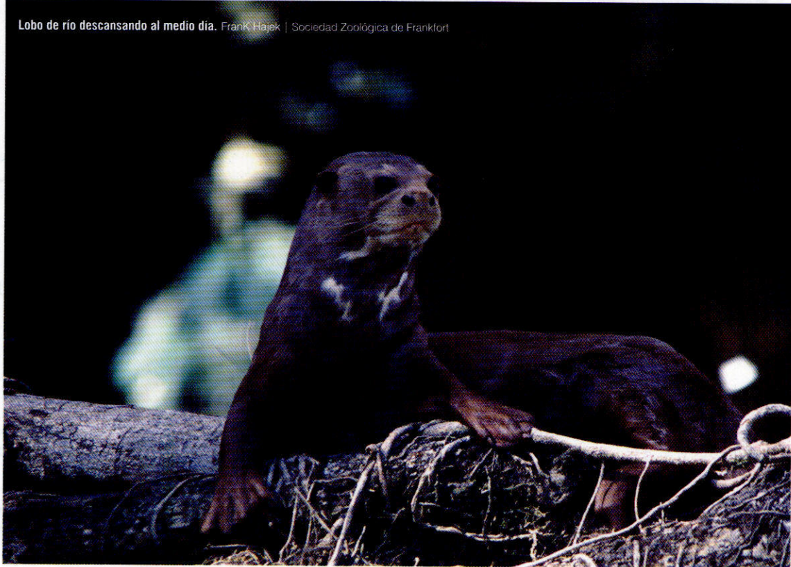
Lobo de río descansando al medio día.