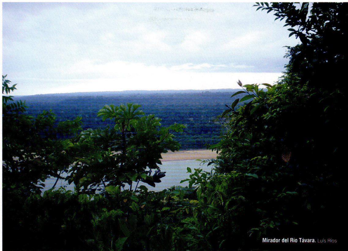
Mirador del Rio Távora. Luis Ríos