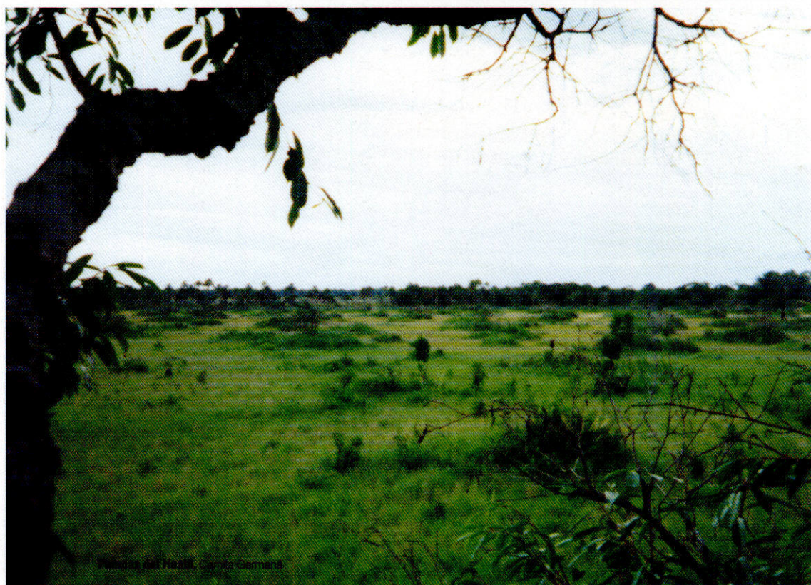
Mirador del Távora. Carlos Garmendia