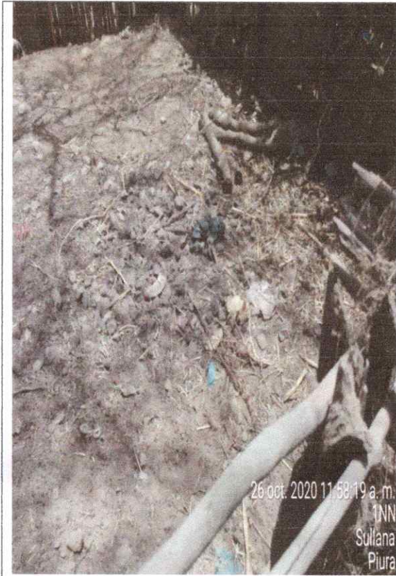
26 oct. 2020 11:58:19 a. m. 1NN Sullana Piura