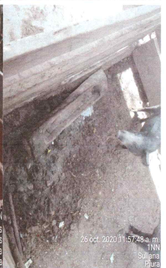
26 oct. 2020 11:57:48 a. m. 1NN Sullana Piura