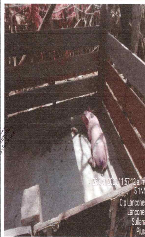
26 oct. 2020 11:57:12 a. m. 5 1NN C.p Lancones Lancones Sullana Piura