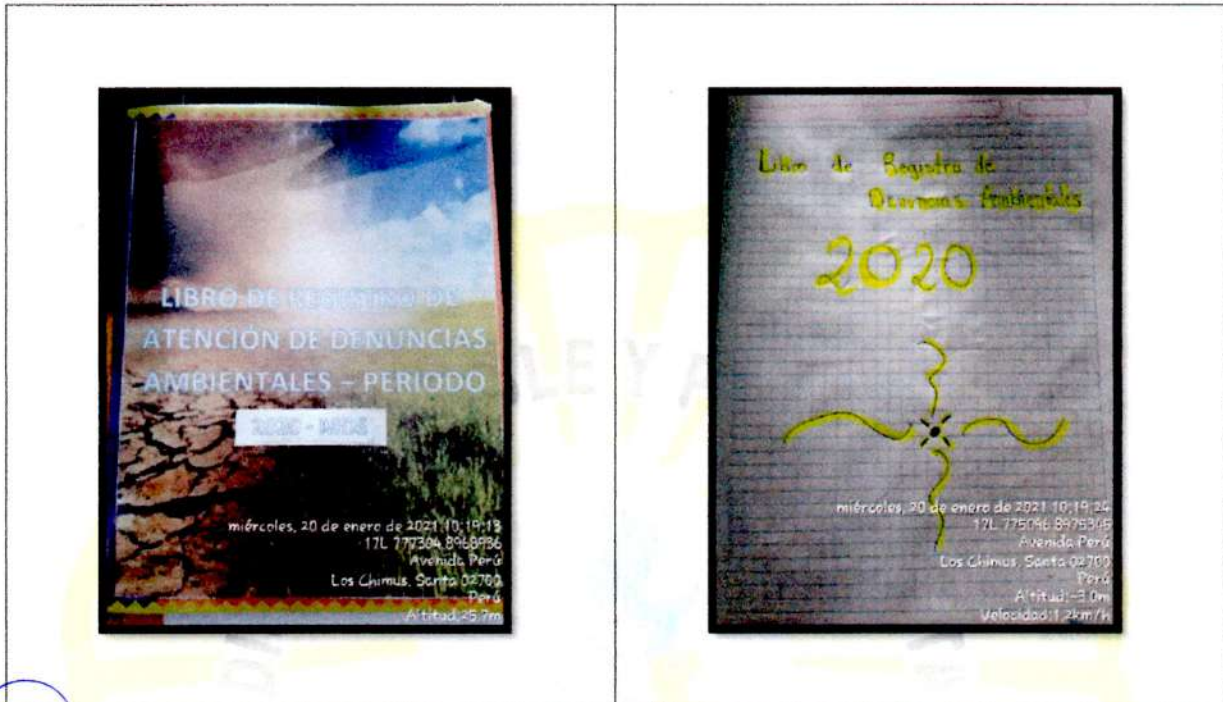
PORTADA DEL LIBRO DE REGISTRO Y ATENCIÓN DE DENUNCIAS AMBIENTALES - 2020