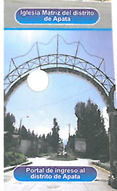
Portal de ingreso al distrito de Apata