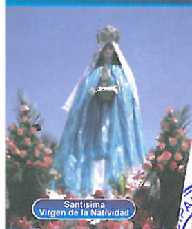
Santísima Virgen de la Natividad

Que, el árbol con Registro N° 001-2020-JUN/JAU/MDA , ubicado en la Plaza Principal de Apata, Provincia de Jauja, Región Junín, cumple con los criterios para ser