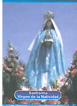
Santísima Virgen de la Natividad

Que, la Ley N° 26839, Ley Sobre la Conservación y Aprovechamiento Sostenible de la Diversidad Biológica, establece en el literal a) del artículo 5°, que el Estado Peruano promueve la priorización de acciones de conservación de ecosistemas, especies y genes, privilegiando aquellos de alto valor ecológico, económico, social y cultural.