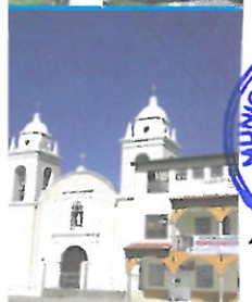
Iglesia Matriz del distrito de Apata