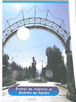
Portal de Ingreso al distrito de Apata