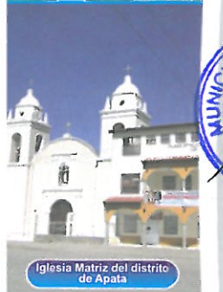
Iglesia Matriz del distrito de Apata