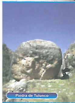
Piedra de Tulumco