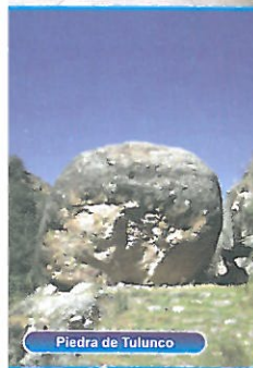
Piedra de Tulunco