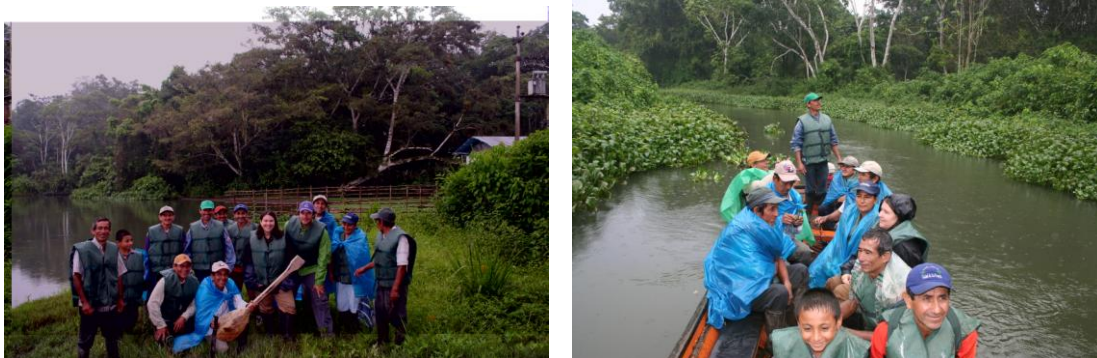
Equipo que participó en la identificación de puntos de interés en el circuito- Sector Lloros

El día 26 , se trabajó en el sector de Lloros para identificar con los miembros de la comisión, los puntos de interés del primer tramo del circuito que se hará en bote. La finalidad de tener identificados estos puntos ayudará a que los guías tengan predeterminadas algunas paradas en el circuito donde puedan interpretar y dar información importante y relevante a sus visitantes. Como resultado del recorrido se marcaron imaginariamente 10 puntos de interés, el siguiente paso será el de recabar información de cada uno de ellos, para usarla de ayuda memoria para el trabajo de guiado a futuro.