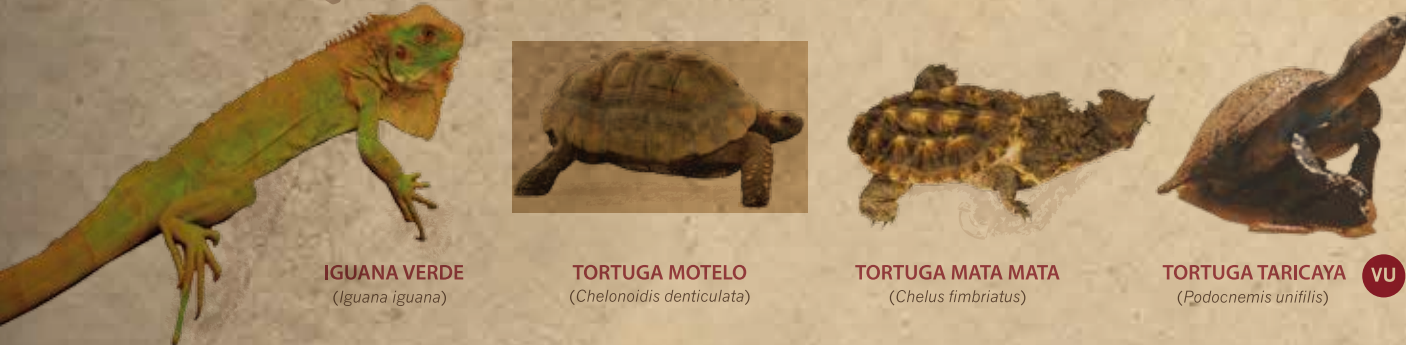
IGUANA VERDE ( Iguana iguana )