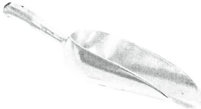
Pala manual - Muestra puntual