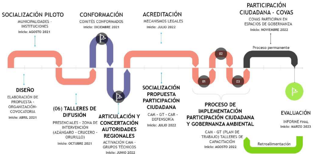
Gráfico I: Propuesta de diseño e implementación de los COVAS