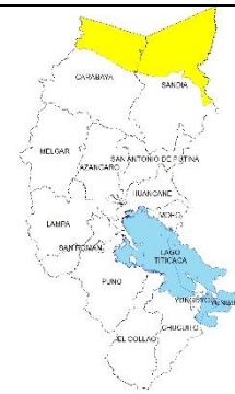
Miércoles 15 junio 2022