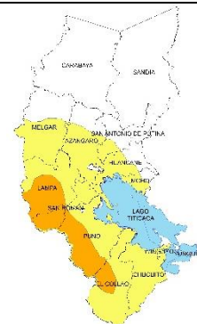
Jueves de abril de 2023