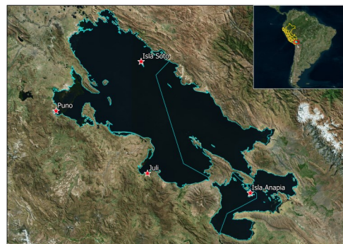
Figura 2. Localización de las estaciones limnológicas en el Lago Titicaca

Principales variables ambientales de la estación fija muelle Puno (Bahía Interior de Puno). El oxígeno disuelto presentó una media mensual de 8,83 mg/L, el pH 9,70 la conductividad eléctrica 1908,6 µS/cm; así mismo se observó que la concentración de clorofila-a, DBO5, nitrógeno total y fósforo total excedieron los rangos establecidos en el ECA-agua categoría 4 (D.S. N° 004-2017-MINAM).