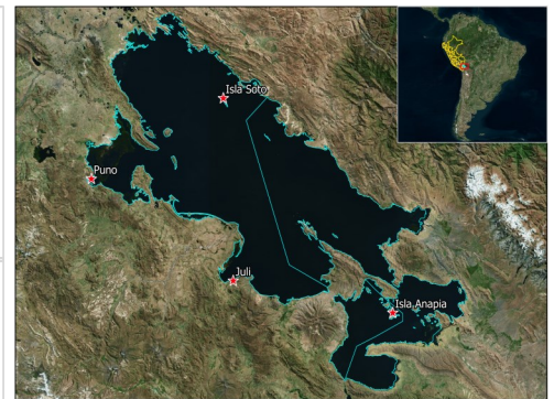
Figura 2. Localización de las estaciones limnológicas en el Lago Titicaca