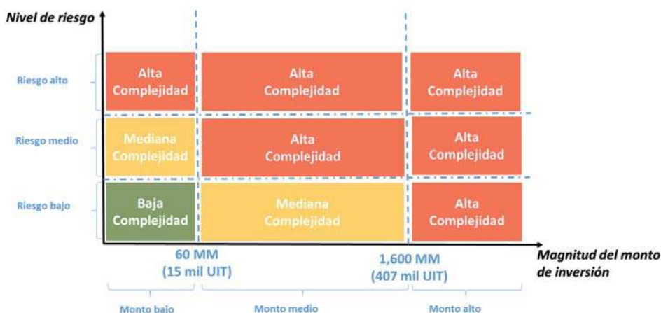
Gráfico N° 01: Clasificación del nivel de complejidad de un proyecto de inversión*

Entonces, a partir de la combinación de los tres niveles de riesgo del proyecto y de las tres categorías del valor del monto de inversión estimado del proyecto, se definen los niveles de complejidad de acuerdo a lo siguiente: